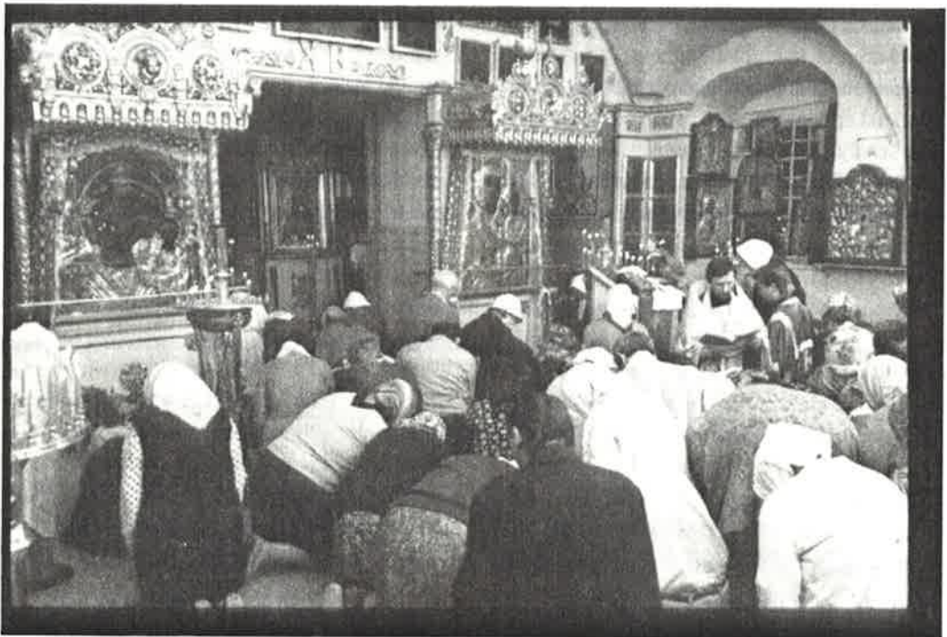
Noin kymmenen prosenttia venäläisistä käy kirkossa kuukausittain. Kuvassa rukouspalvelus Kazanin Jumalanäidin kirkosta. Kolomenskaja, Moskova.

Myös suurin osa yliopistokyselyyn vastanneista opiskelijoista piti itseään ortodokseina (70 %). Heistä kuitenkin vain 8 prosenttia halusi samaistua valta-asemassa olevaan Moskovan patriarkaatin alaiseen Venäjän ortodoksisen kirkkoon. Suurimalle osalle ortodoksina oleminen merkitsi olemista ”kristitty yleensä” (37 %) tai ”ortodoksi yleensä” (22 %). Myös yliopistokyselyyn vastanneista useampi piti itseään ortodoksina kuin uskovaisena (53 %) ja 40 prosenttia ateisteista ja 14 prosenttia ei-