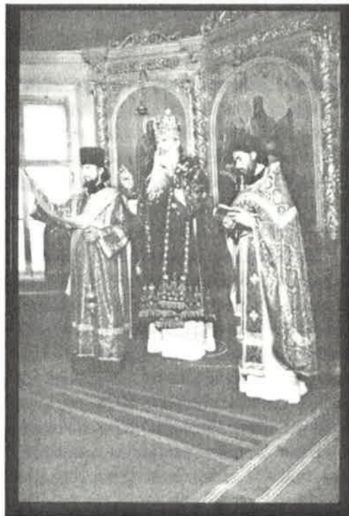
Volokolamskin ja Jurjevin metropoliitta Pitirim toimittamassa palvelusta diakonin ja papin kanssa.

Venäläinen ortodoksisuus liitetään venäläiseen ja slaavilaiseen kansakuntaan. Venäjän ortodoksisen kirkon sosiaalietätikan mukaan joko etnistä tai valtiollista kansaa voidaan pitää ortodoksisena kansana, jos se pääsääntöisesti edustaa ortodoksisista uskoa. Koska Venäjän kansalaisten enem-