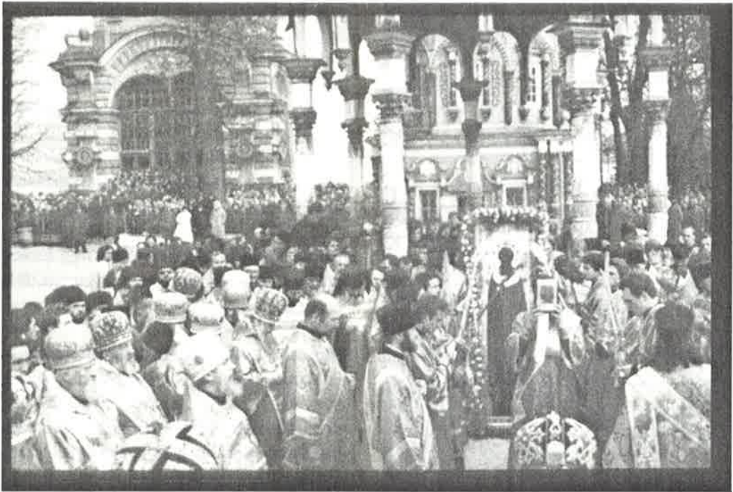
Rukouspalvelus Pyhän Sergei Radonežilaisen ikonin edessä kolminaisuudenpäivänä. Sergein luostari, Sergiev Pasad (ent. Zagorsk).

Hänen mukaansa modernit yhteiskunnat eivät ole yhä maallisempia kasvaneen rationaalisuuden vuoksi, vaan siksi, että ne ovat yhä huonompia säilyttämään kollektiivista muistiaan merkityksen lähteenä. Venäjän uskonnollisella kentällä ei ole ollut mahdollisuutta läntisen Euroopan tavoin säilyttää muistiaan luonnollisesti, vaan yhteiskunta on valtion johdon taholta pyritty maallistamaan. Miten ortodoksisuuden yhteiskunnallinen merkitys suhteutuu sekularisaatio-paradigmaan?