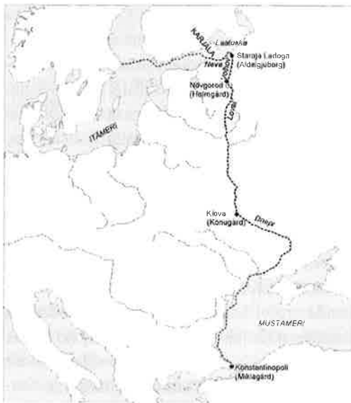
Kuva 1. Varjagien reitti Konstantinopoliin (Miklagårdiin).

Kristinuskon leviäminen pohjoiseen viikinkikaupan myötä. Viimeistään 750-luvulta lähtien varjagit olivat matkanneet etelään Venäjän jokiverkoston pitkin (Noonan 1998, 346-347). Koska varjagien idänreitti kulki Suomenlahden rantoja pitkin, Nevan kautta Laatokkaan (kuva 1), olivat varjagit todennäköisesti tuttuja myös karjalaisille. Kontakteista skandinaavien kanssa kertovat monet viikinkiaikaiset löydöt Karjalasta (Uino 2003, 356). Myös kauppapaikat, kuten Staraja Ladoga (viikinkien Aldeigjuborg) ja Novgorod (Holmgård), sijaitsivat niin lähellä Karjalaa hyvien jokireittien varrella, että karjalaisilla on luultavasti ollut yhteyksiä niihin.