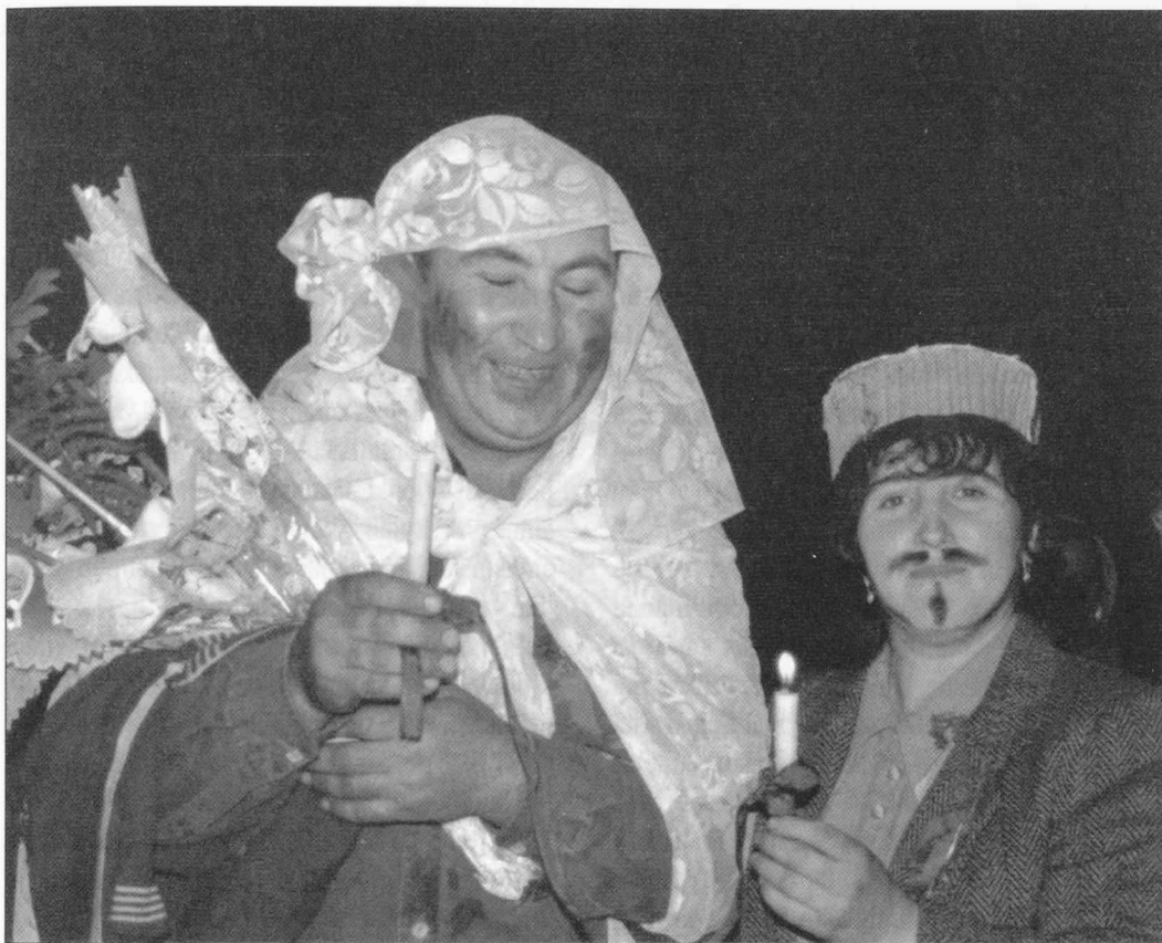
"Nas" ja "nasa" uusissa rooleissaan valemorsiamena ja –sulhasena.

äidin vieressä hänen kutsumansa naiset. Miniää vastapäätä istuutuvat sulhasen naissukulaiset, ja tämä on ensimmäinen kerta kun morsian/miniä istuu tärkeimmässä juhlapöydässä. Ilmeisesti pahimmat miniää uhkaavat vaaratilanteet ovat ohi, joten hän voi olla huomion keskipisteenä.