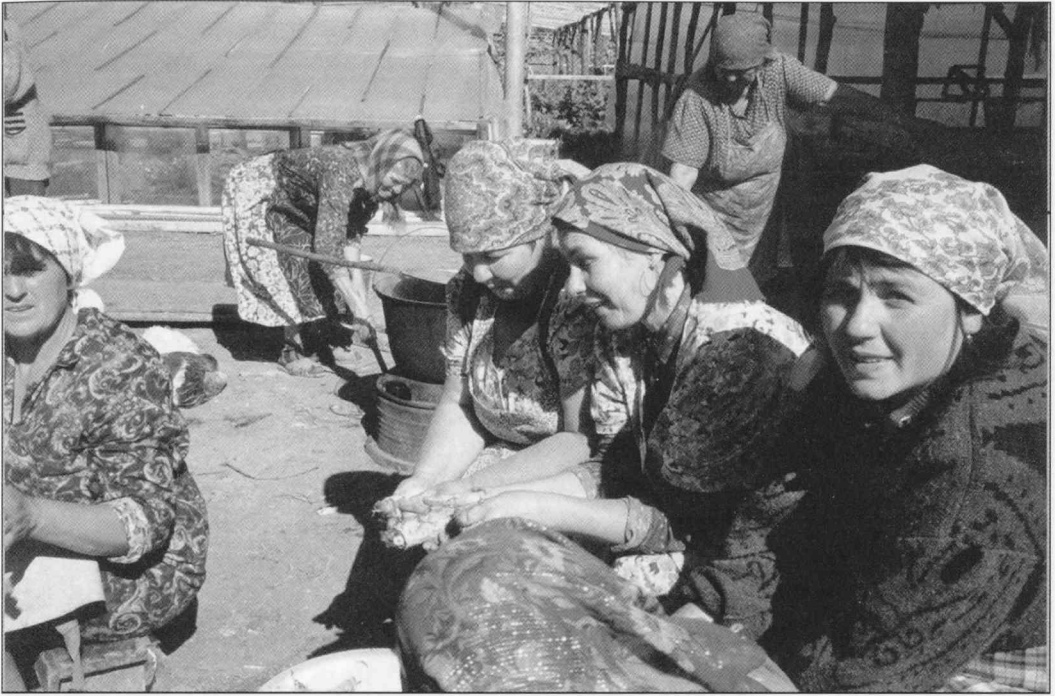
Hääruokien valmistus aloitetaan talkootöinä häitä edeltävänä torstaina. (kuva E. Pääkkönen 1999)

vietettävä naisten juhla tai syntymäpäivät tulivat yhä tärkeämmiksi aina 1970-luvulta lähtien. Osaselityksenä on taloudellinen kasvu ja se, että sosialismin aikana rahaa oli vaikea sijoittaa muuhun kuin yksityiseen kulutukseen. Kun kaikki tarpeellinen perheen taloutta varten oli hankittu eikä muita sijoituskohteita ollut, materiaallinen kasvu käytettiin perheen vaurauden esittelyyn, mikä käy myös esimerkiksi sosiaalisesta varallisuudesta (Bourdieu 1985, 158-241).