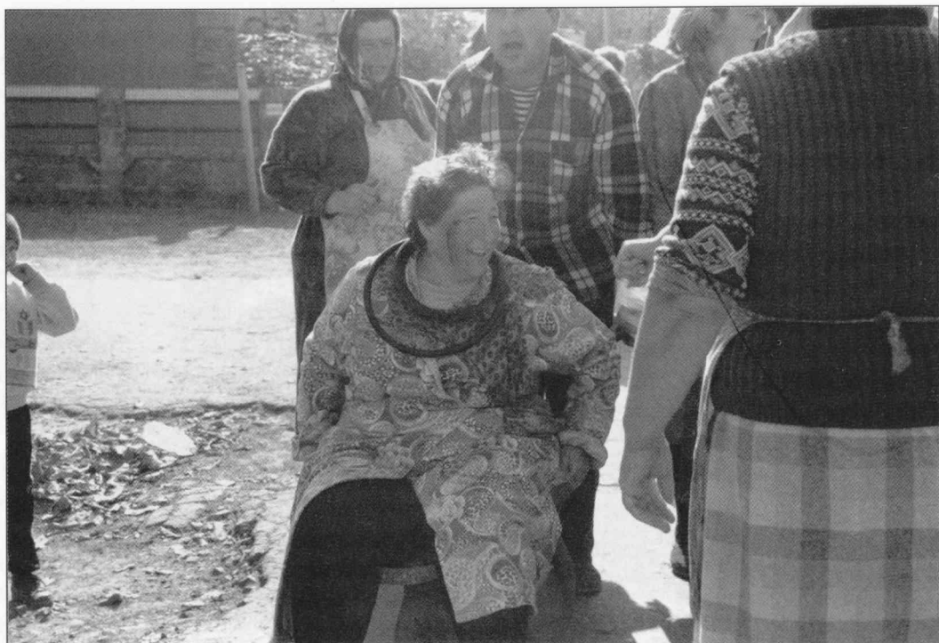
Anoppi saa kyytiä.

sen yhden elämänkierron vaiheen päättymisestä, symbolisesta kuolemasta. Pohjimmiltaan nuoren naisen kannalta avioliitto on portti aikuisuuteen ja, kuten toivottavaa, hallitun seksuaalisuuden maailmaan, sillä suvun kunnia määrittyy tytön neitsyyden ja vaimon kunniallisuuden mukaan.