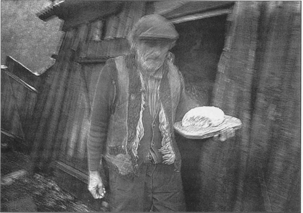
Syrovar. Ukrainan Karpaateilta.