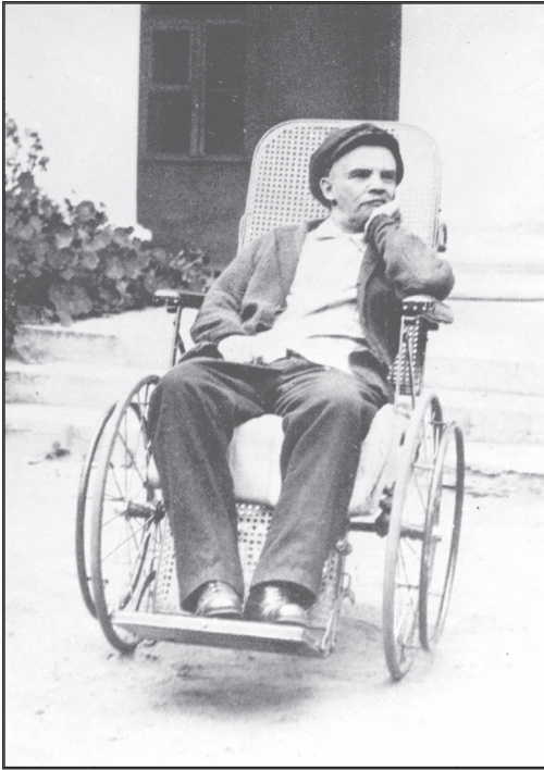
Lenin Gorkin kylässä kesällä 1923. Ei tietoa aiemmista julkaisuista.

jäsenet Leninin ”kansallista liberalismia” vastaan. Leninin kansallisuusajattelussa punaisena lankana kulki periaate ”kansakuntien itsemääräämisoikeudesta”. Jo ennen vallankumousta hän painotti, että olisi sosialismin kavaltamista kieltäytyä toteuttamasta kansakuntien itsemääräämistä sosialismin aikana. (Lenin, osa 22, 312.) Tähän Leninin periaatteelliseen linjaan liittyi myös Suomen itsenäistymiskysymys.