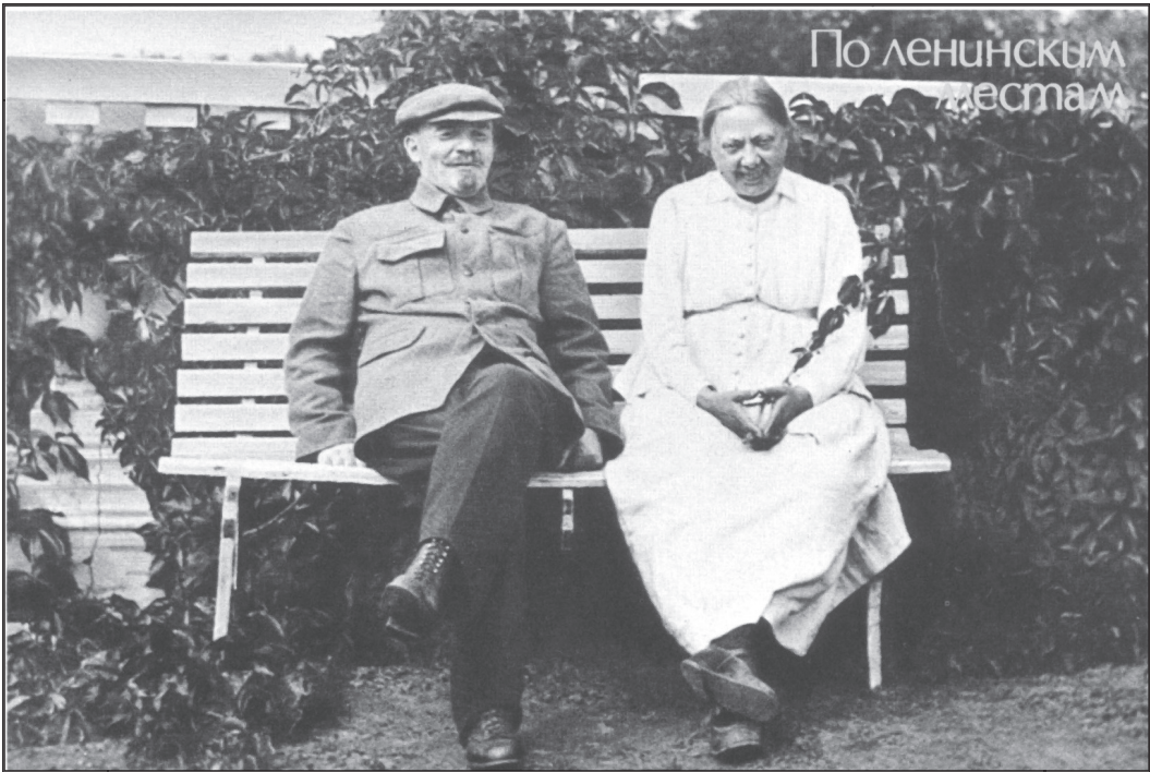
Lenin ja Krupskaja Gorkin kylässä elokuun alussa 1922. Kuva julkaistiin ensimmäisen kerran Pravdan kuvallitteessä 24.9.1922 otsikolla ”Toveri Lenin lepäämässä”.

Stalinin vastaisessa taistelussa Lenin kääntyi Lev Trotskin puoleen. Maaliskuussa 1923 Lenin saneli puhelimitse ”ehdottoman salaisen” kirjeen tälle ”kunnioitetulle toverille”. Siinä hän pyysi Trotskia ottamaan tehtäväkseen Leninin kannan puolustamisen periaatteellisesti tärkeässä Gruusian kiistakysymyksessä, koska se oli Stalinin ja Dzeržinskin ”vainottavana” eikä Lenin voinut luottaa heidän tasapuolisuuteensa. Hermostollisesta sairaudesta kärsinyt Lenin sanoi voivansa olla rauhallinen, jos Trotski suostuisi ottamaan huolekseen asian puolustamisen. (Lenin, osa 45, 571.) Trotski kuitenkin kieltäytyi tehtävästä sairastumisensa vedoten.