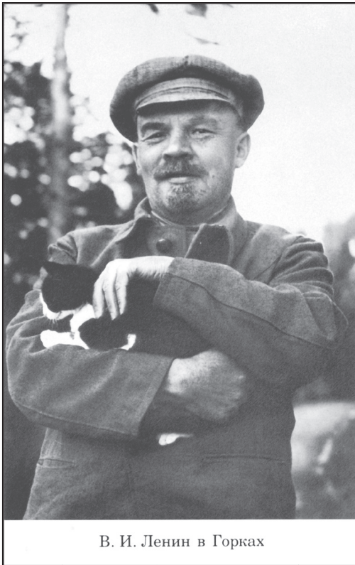
В. И. Ленин в Горках

Lenin Gorkin kylässä elo-syyskuun vaihteessa 1922. Kuva on julkaistu ensimmäisen kerran Pravdan kuvaliitteessä 24.9.1922 otsikolla "Toveri Lenin lepäämässä".