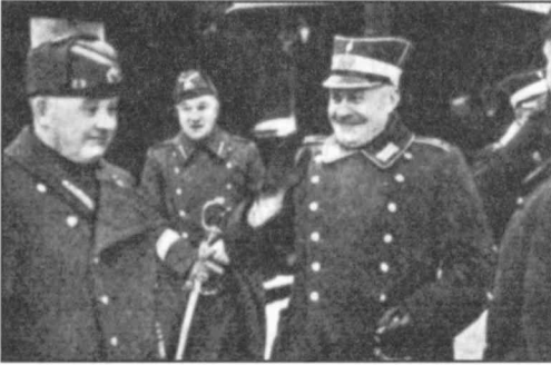
Kuva 4: Berķis kävi 1940 tapaamassa ainakin kahdesti virolaista virkaveljeään, kenraali Laidoneria (vas.), mutta vierailut eivät tuottaneet konkreettisia tuloksia. (Virolainen lehtikuva helmikuulta 1940.)

Britannian apu Suomelle toteutuisi. Berķis kävi puheen jälkeen ainakin kahdesti Tallinnassa tapaamassa kollegaansa Laidoneria, mutta mitään konkreettisia tuloksia vierailuilla ei ilmeisesti ollut ( Valdības Vēstnesis 12.2. 1940).