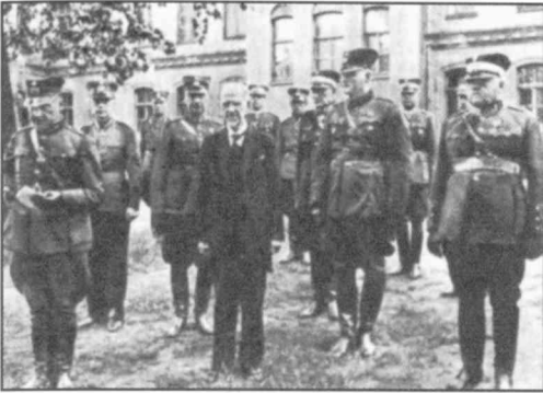
Kuva 5: Miehittäjien 1940 valitsema uusi pääministeri Kirhesteins ympärillään mm. uusi sotaministeri ja uusi sotaväen päällikkö sekä armeijan "pääpoliitikki". Viimeksi mainittu (toinen vasemmalta) oli Bruno Kalnins, joka oli ollut tähän asti poliittisena pakolaisena Suomessa. (Latvialainen lehtikuva heinäkuulta 1940.)

toonsa iltapäivällä 20. kesäkuuta (Hallituksen pöytäkirja 20.6. 1940, LVVA fond 1307, 1, dok. 317). Asialistalla oli viljan myyminen Suomeen. Hallitus päätti toimittaa 5 249 tonnia ruista Valtion viljavarastolle ja 3 120 tonnia eri yrityksille Suomeen. Sitten Ulmanis hyvästeli ministerinsä.