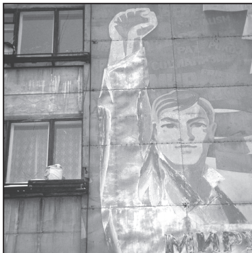
Sosialismi.

Vuonna 2002 Karjalan tasavallan päämies Sergei Katanandov nosti oikeusjutun politika-karelia.ru -sivustoa vastaan. Oikeusjuttu kesti vuoden verran, huhtikuusta 2002 maaliskuuhun 2003, ja oli niin henkisesti kuin taloudellisesti raskas koettelemus myös allekirjoittaneelle. Minua syytettiin siitä, että olisin toimittajana tietoisesti loukannut tasavallan päämiehen henkilökohtaista kunniaa arvostellesani hänen talouspolitiikkaansa tehottomuutta. Syyte