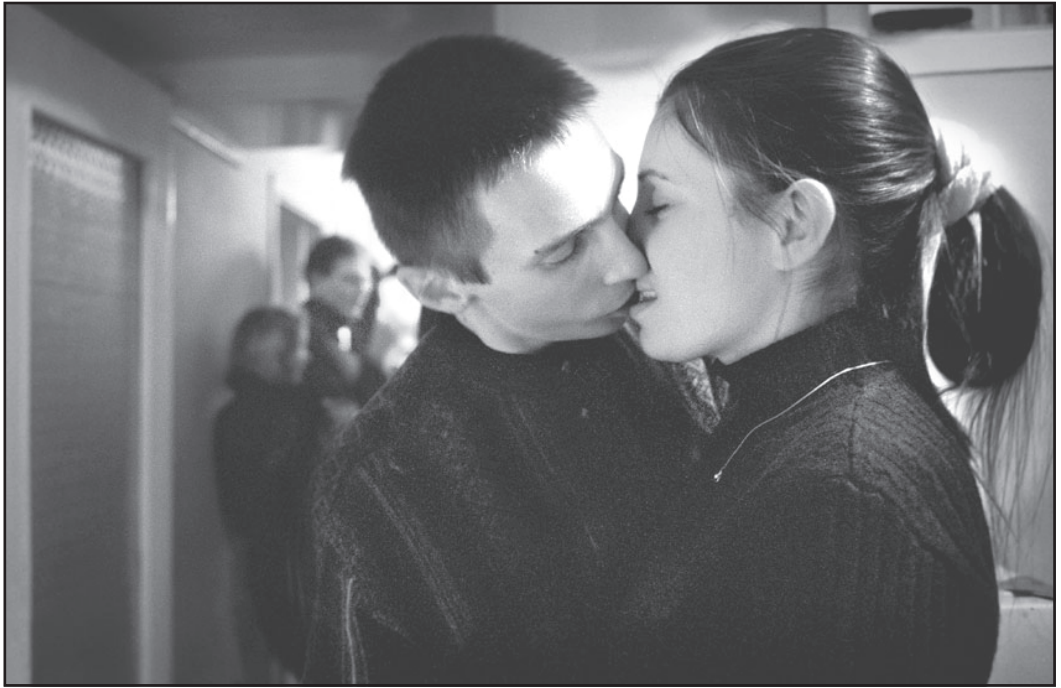
Slaavilaisen sielun arvoitus?

media-analyysi on omani ja siis näkökulmaltaan hyvin subjektiivinen.