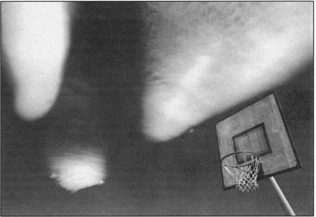
Valokuvia Duško Miljanićin teossarjasta Sky Net.

Ahkera osallistuminen näyttelyihin ja kansainväliset kontaktit ovat vaikuttaneet merkittävästi Miljanićin persoonallisen kuvallisen ilmaisun muotoutumiseen. Miljanićin valokuvissa korkea ammatitaito sekä taiteellinen ilmaisu ovat hyvin tasapainossa.