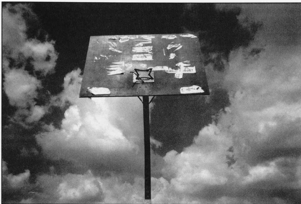
Valokuvia Duško Miljanićin teossarjasta Sky Net.