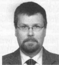
A n t t i S a r a s o

Virolaiset olivat muita edellä juuri kansalaisyhteiskunnan rakentamisessa, vaihtoehtoisen politiikan luomisessa. Viro oli monelle oppositiohenkiselle esimerkki, josta kannatti ottaa oppia. Tämä oli se panos, jonka virolaiset antoivat Neuvostoliiton hajoamiseen. Kunniata Neuvostoliiton hajottamisesta ei yksikään tapaamani virolainen halua ottaa, sen sijaan mielihyvin muistutetaan, että moni prosessi alkoi juuri virolaisten ideoista.