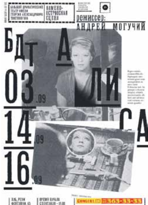
Liisa (Lewis Carrollin Liisa ihmemaas- sa -romaanin pohjalta) Ohjaus Andrei Mogutši, 2013.