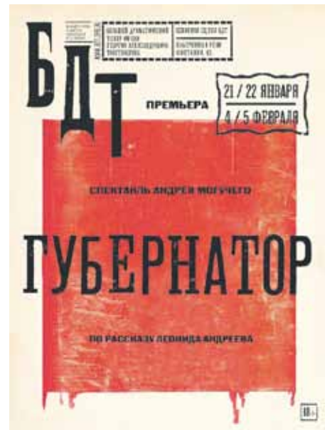
Kuvernööri (Leonid Andrejevin samannimisen novellin pohjalta), Ohjaus Andrei Mogutši, 2017