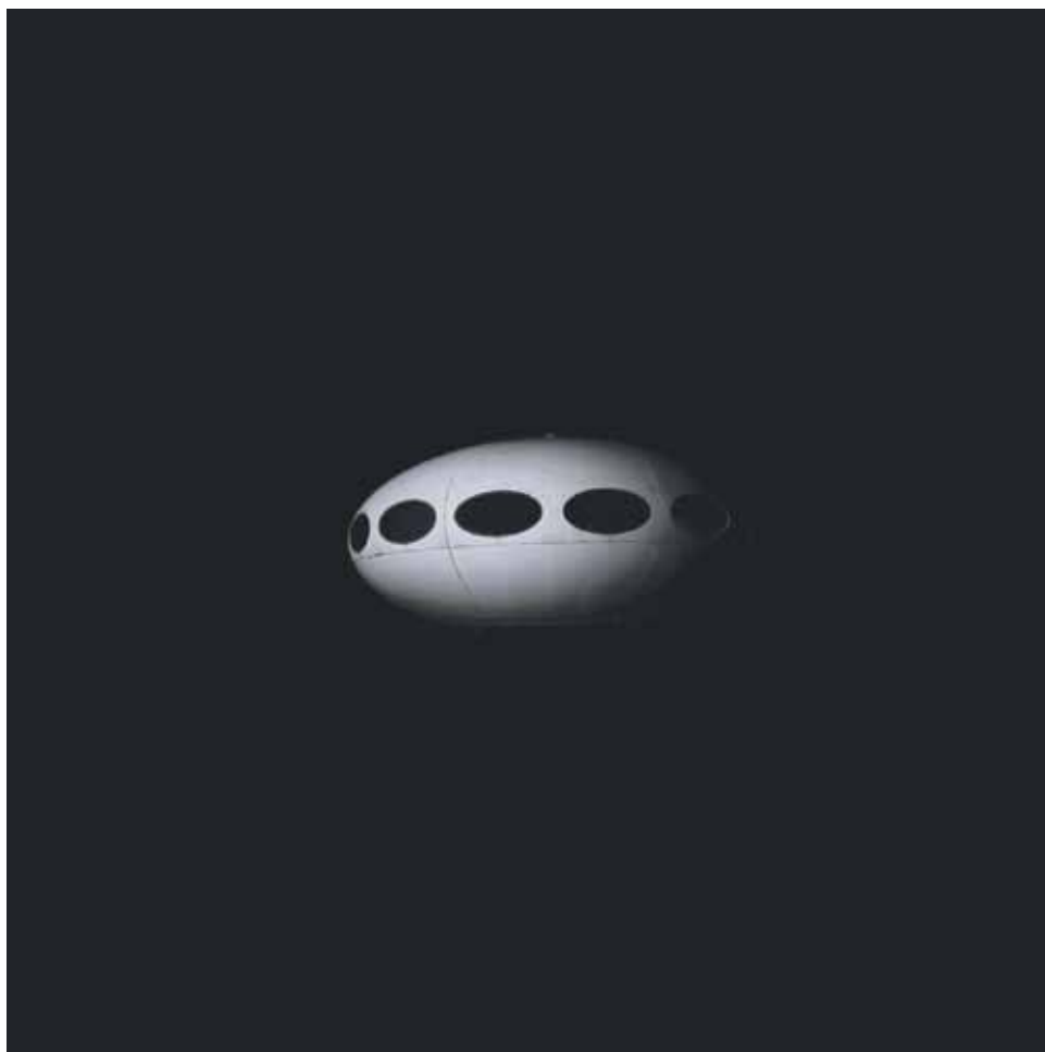
Futura-talo sarjasta Kadonnut horisontti, Dombai, Venäjä, 2016.