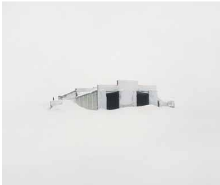
Varasto pohjoises- sa sarjasta Sulje- tut alueet, Komi, Venäjä, 2014.