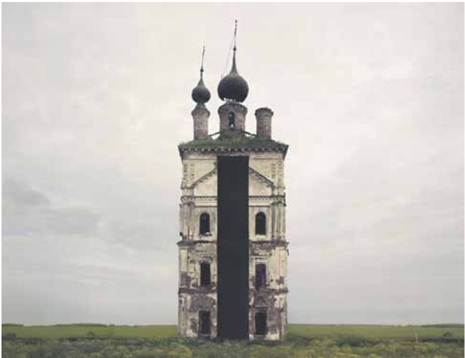
Valokuva 1 sarjasta Monumentit, 2017.