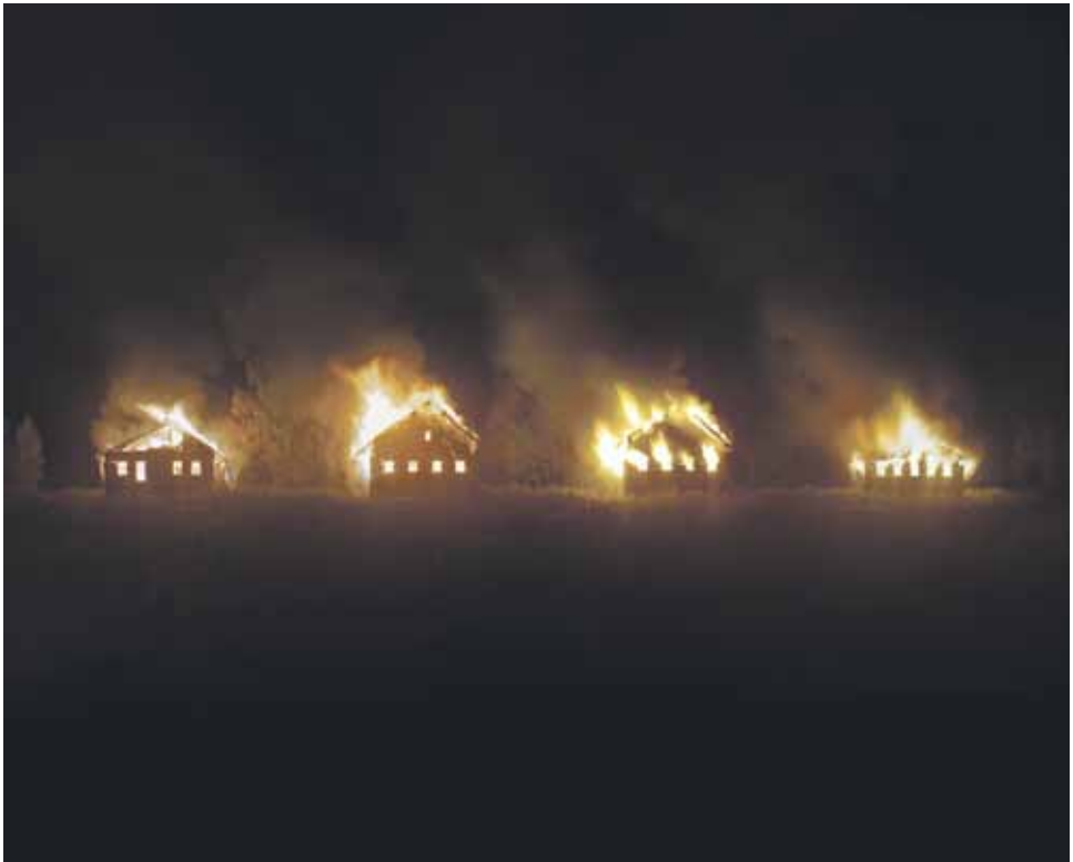
Valokuva 12 sarjasta Isänmaa, 2017.