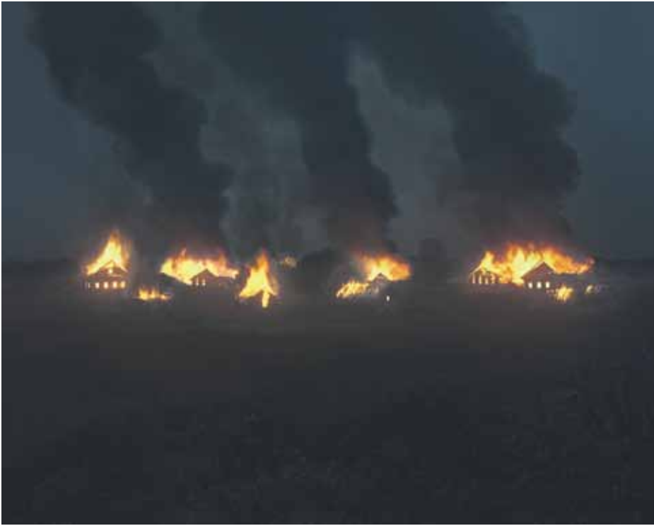
Valokuva 1 sarjasta Isänmaa, 2016.