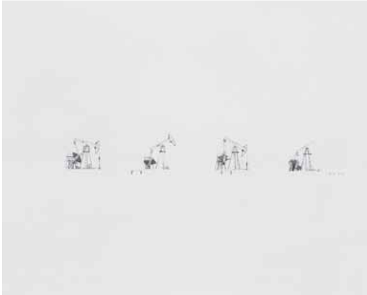
Hylätyt öljy- pumpput sarjasta Suljetut alueet, Baškiria, Venäjä, 2014.