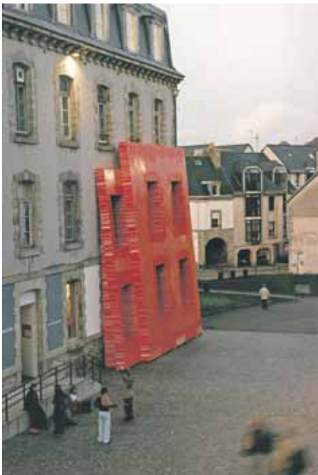
Kortteli, Centre for Contemporary Arts, Quimper, Ranska. 2006