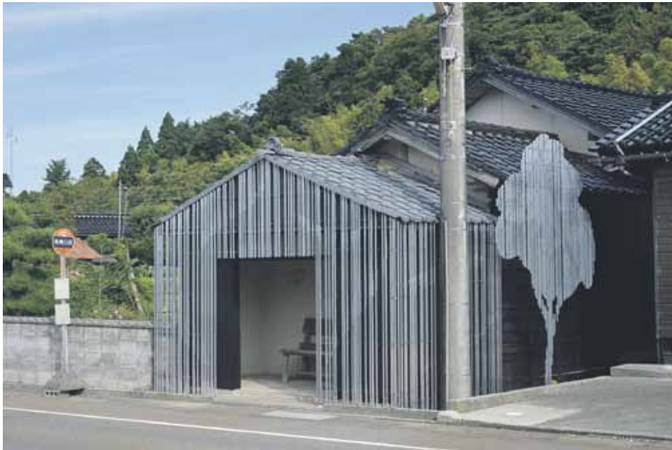
Bussipysäkki nro. 2, Suzu, Japani, 2017.