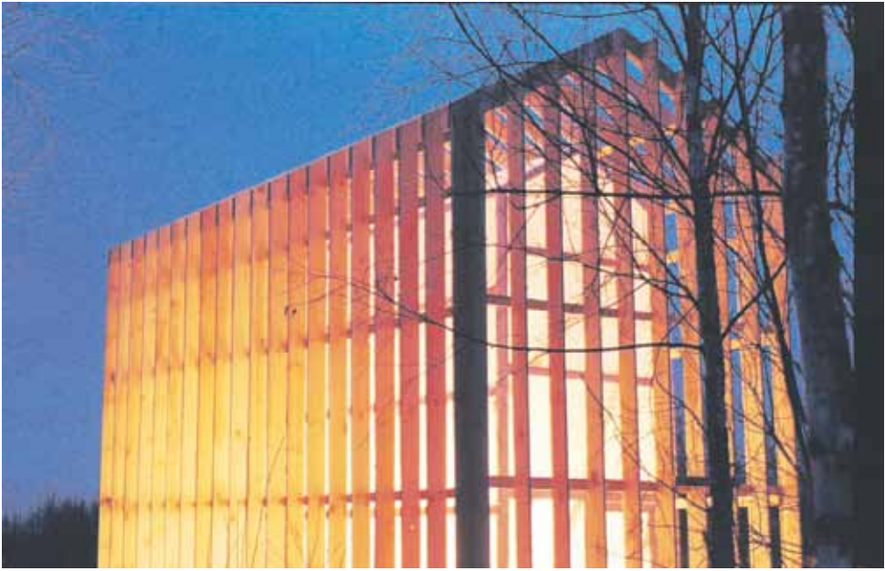
Mökki. Basilika, Arkstojanie-festivaali, Nikola-Lenivets, Kalugan alue, Venäjä. 2008.