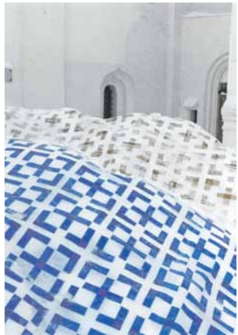
Peite, Ferapontovo, Vologda, Venäjä, 2003.