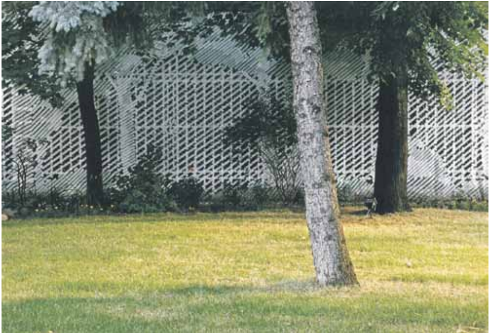
Luxembourgien puisto, Luxembourgien suurlähetystön puisto, Moskova, Venäjä 2005.