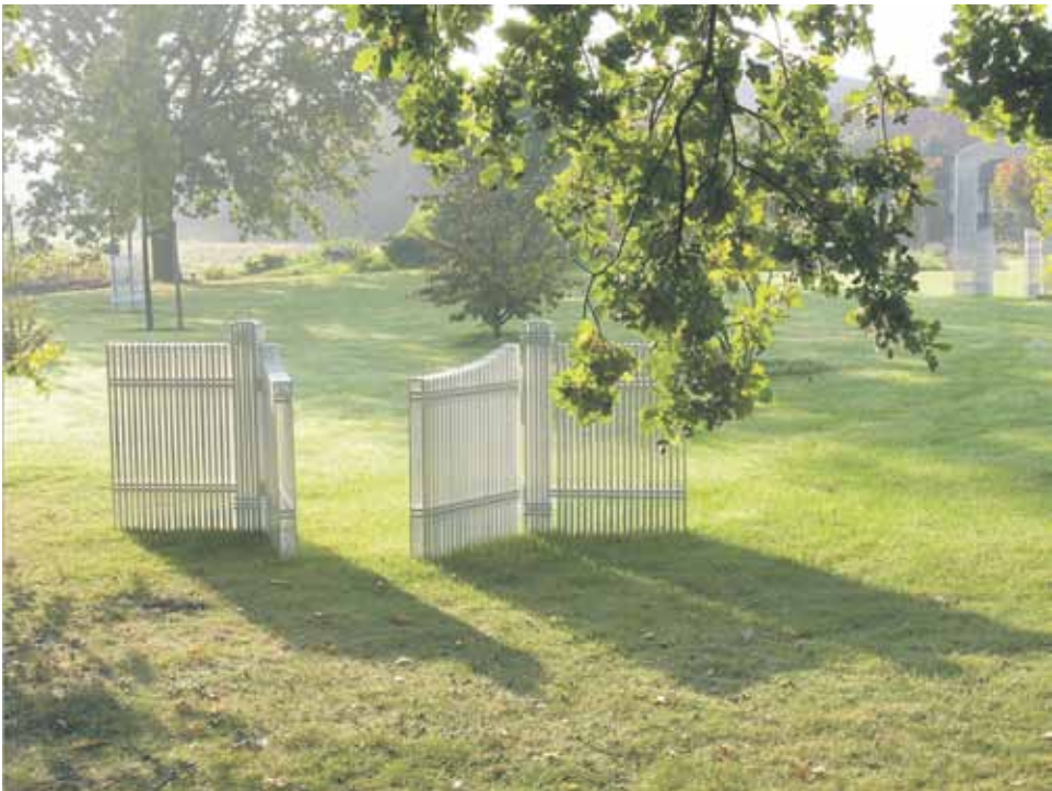
Portit, Veistosnäyttely, Haag, Alankomaat, 2013.