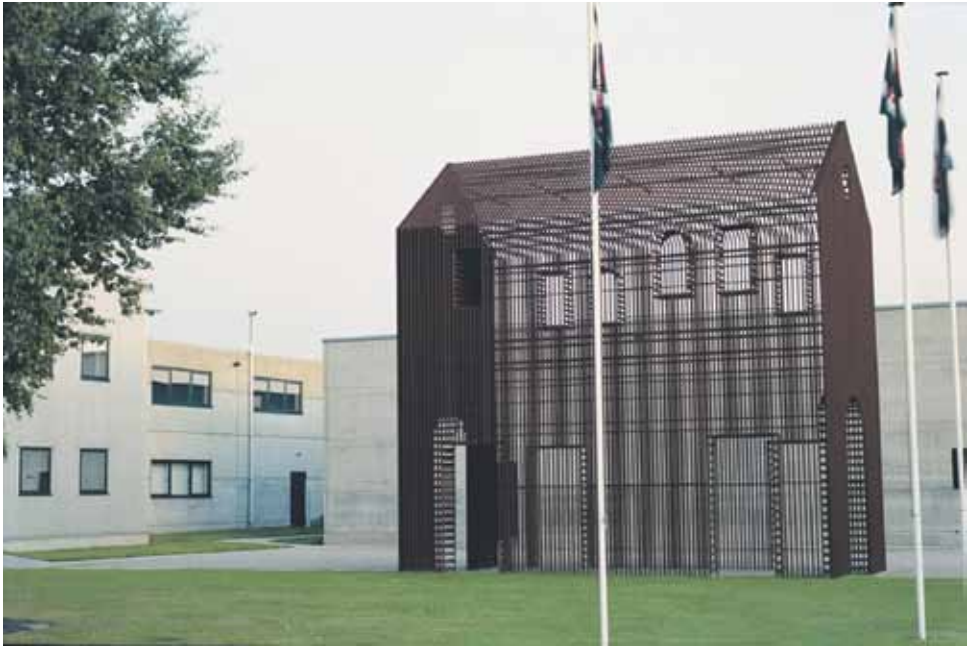
Ironia, Nieuwerkerken, Belgia, 2009.