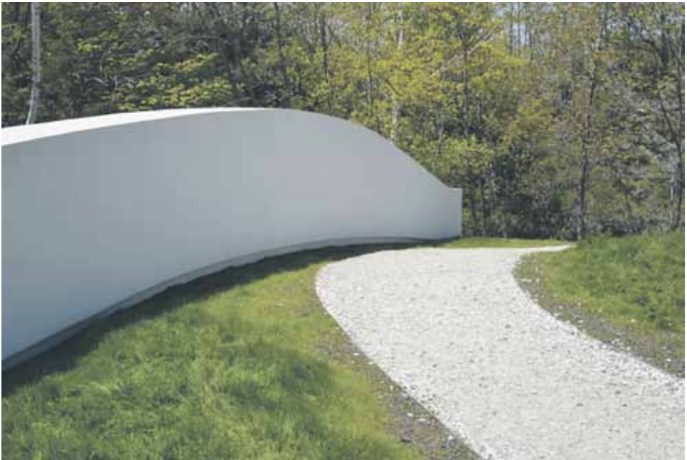
TurnPark, West Stockbridge, MA, Yhdysvallat, 2013-2017.