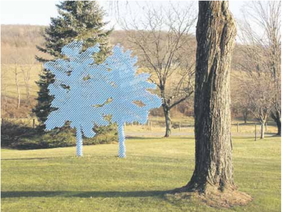
Siniset puut, New York, Yhdysvallat, 2011.