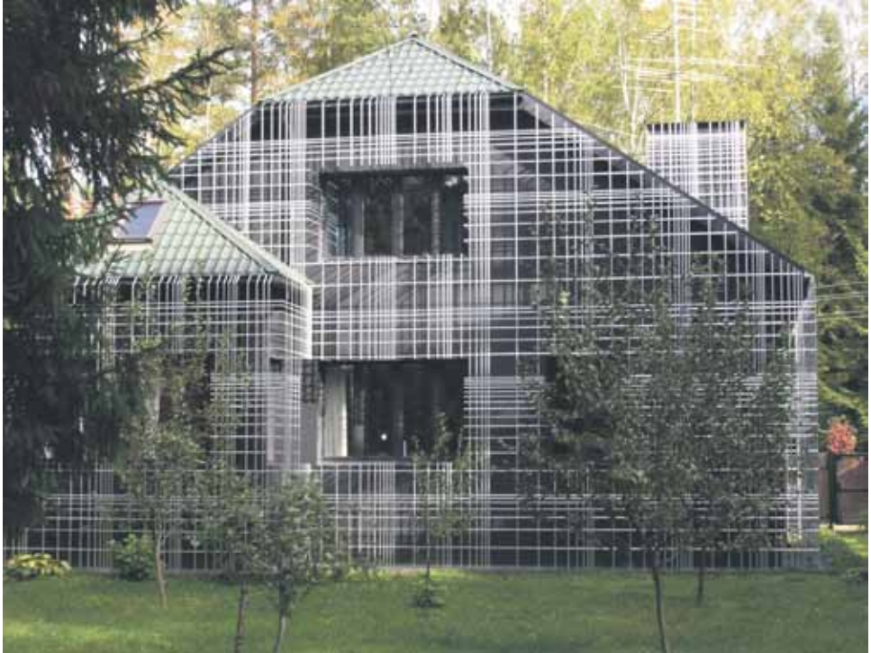
Alumiinitalo, Moskovan alue, 2008.