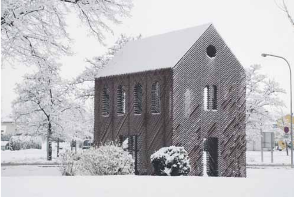
Unter de Linde, Otten Kunst Raum, Hohenems, Itävälta. 2008.