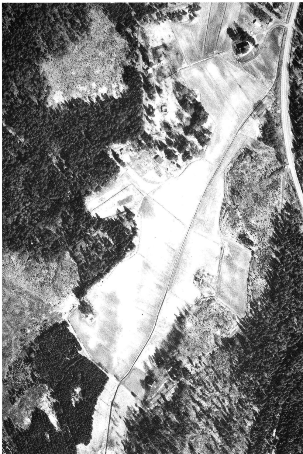
Fig. 1. Flygfotografi över Riddarkil, upptill i bildens mitt. I nedre kanten ses Kuggviken. Publicerad med tillstånd av lantmäteristyrelsen.