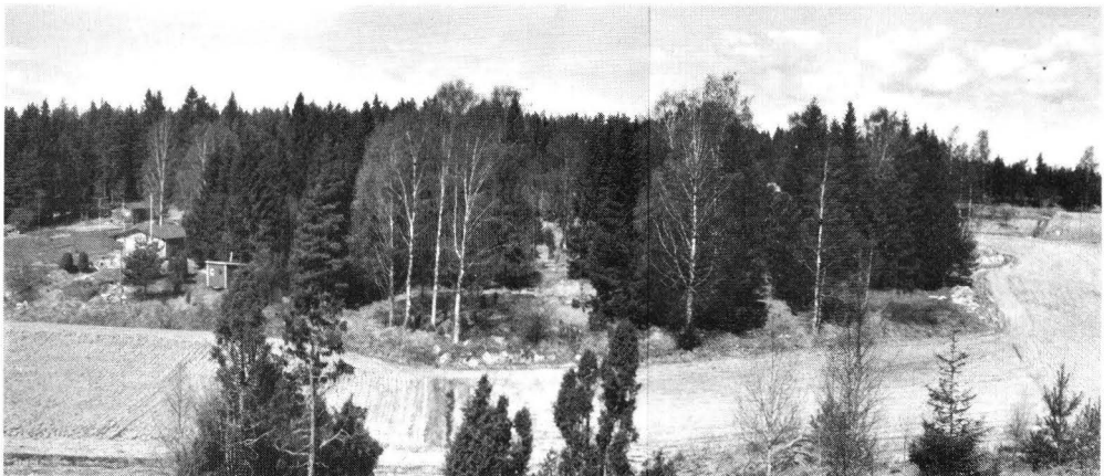
Fig. 2. Riddarkil från öster.

Mellan den nedersta och översta vallen i uddens södra del finns en andra platå, i vilken man nyligen grävt en liten damm. Vid denna platås västra kant finns områdets fjärde vall (D). Väster om denna har man för några år sedan uppfört både en