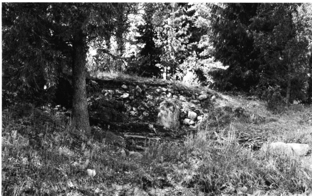
Fig. 4. Platsen för den gamla ladan vid C-vallens östra kant.

vik kunde vara ett tecken på att traditionen bevarats, ehuru själva vallarna inte mera tjänstgjort som den egentliga hamnen.