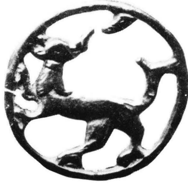
3. Rengaskoru Knjažan kylän luota Kievin kuvernementista (Khanenko 1902, pl. XVII: 252, po. 352).

Näissä korurenkaissa on eläinaiheen käsittely sulavan linjakas, voi sanoa elegantti. Käsittelytyyli viittaa vahvasti Orientin maailmaan. Samaan suuntaan osoittaa myöskin itse korun eläin, gepardi l. metsästysleopardi ( Acinonyx jubatus ). 3 Se elää lähes koko Afrikassa sekä Egyptistä Intiaan aroilla ja aavikoilla. Tätä nopeajalkaista, lyhyillä matkoilla jopa yli sadan kilometrin tuntivauhdin saavuttavaa eläintä käytettiin esiintymisalueellaan ruhtinashoveissa opetettuna metsästyseläimenä (Walker 1964, 1282; esim. Sourdél-Thomine 1973, kuva 374, jossa on paperille maalattu miniatyyri keisari Akbarin hovista n. 1590).