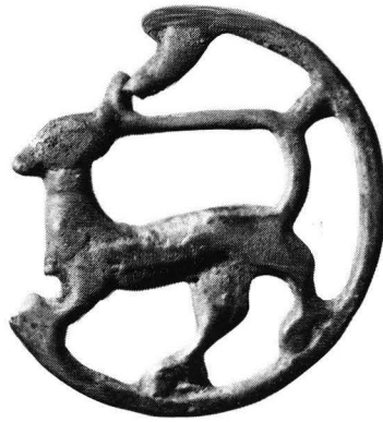
2. Kuusamon rengaskoru (KM Kt. tsto 5031: 4).

sessä verrattaessa Kuusamon ja Kuuselan renkaita toisiinsa todettiin, että molemmat esineet on valettu yhdessä ja samassa muotissa. 2