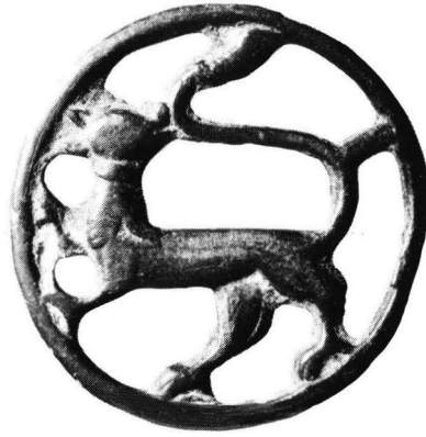
1. Kuuselan rengaskoru (KM 22593).