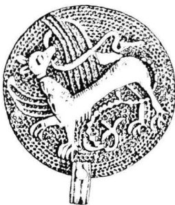
4. Sakkolan Loposenmäen reliikkirasian kansi halkaisija 35 mm (KM 4421: 6).

Muiden valettujen eläinkoristeisten renkaiden ohella ovat Kuusamon ja Kuuselan renkaiden kaltaiset esineet olleet suosittuja saamelaisten keskuudessa ja pitkään käytössä. Samuli Paulaharju on piirtänyt tämän vuosisadan alussa Pohjois-Lapissa vyöllispyörän (Paulaharju 1965, 146; Kuva 5), joka on pitkälle degeneroitunut mutta selvästi johdettavissa Kuusamon ja Kuuselan renkaiden kaltaisesta esikuvasta. Myös Karessuvannossa on vastaavanlainen jäljitelmä ollut käytössä vielä 1910-luvulla (Elgström 1922, 240, Kuva 6) ja Enontekiöllä (Rácz 1972, kuva 126). Valmistetaanpa korausta sen degeneroituneessa muodossa hopeasta nykyisinkin ainakin Kautokeinin ja Inarin hopeapajoissa (Juhsin myyntiluettelo 1973, mm. nro 34; Inarin Hopean myyntiluettelo 1983, nro:t 35 ja 39).