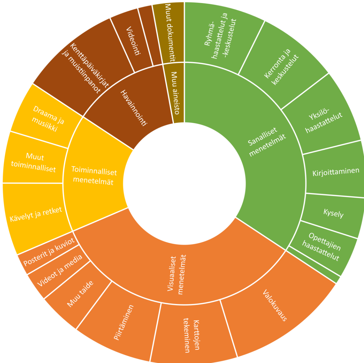
KUVIO 3 Tutkimusmenetelmien jakautuminen aiemman tutkimuksen perusteella

■ Visuaaliset menetelmät ■ Toiminnalliset menetelmät ■ Sanalliset menetelmät ■ Havainnointi ■ Muu aineisto