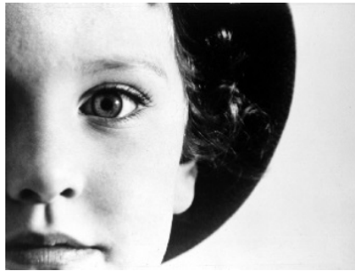
Max Burchartz: "Lotte (Auge)" från 1928