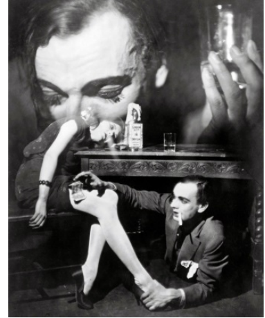
Francis Bruguière: The Way (1929)