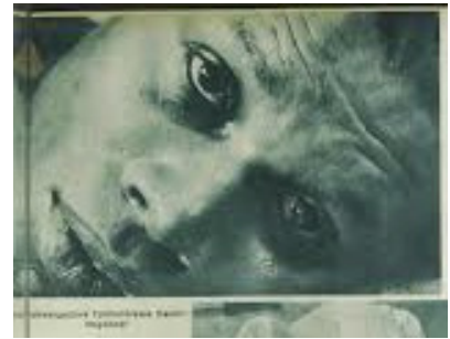
Folkwangschule Fotoklasse: "Negerkopf"