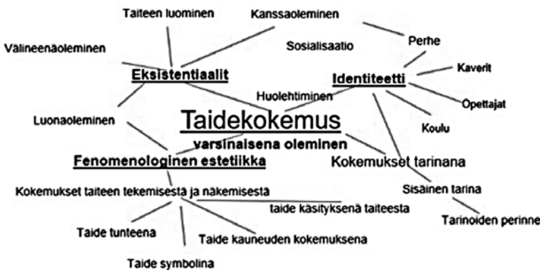
KUVIO 3. Käsitekartta kokemuskertomusten analyysin merkitysluokista (ks. Tenhu 2007)