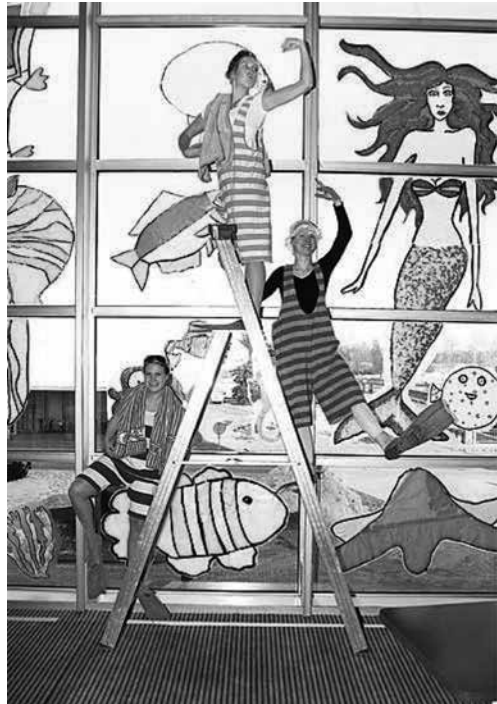
KUVA. TAIKA-opiskelijat ovat menossa uimaan. Lasten ja nuorten teatteripäivät 2008. Oulun teatterin merellisestä koristelusta vastasi osa Myllytullin ja Hintan kuvataideluokista.

Opetussuunnitelmasta nostamme esimerkkinä esiin ensimmäisellä vuosikurssilla olleet opintojaksot Orientoiva harjoittelu ja Pedagoginen seminaari 1. Harjoittelun ohessa opiskelijat suunnittelivat ja toteuttivat lasten ja nuorten teatteripäiville 2008 Oulun kaupunginteatteriin ohjelmaa (ks. Kuva).