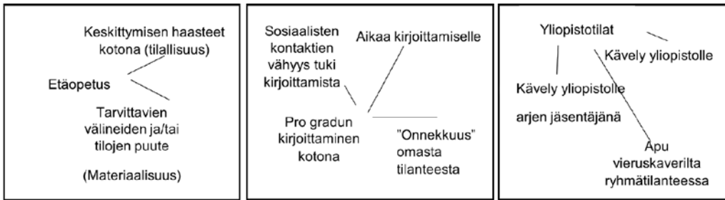
KUVIO 1. Esimerkki analyysikartasta

yksikkönä olivat erilaiset pandemia-ajan opiskelukieoumat eli se, miten opiskelukokemuksissa yhdistyivät aika, tila ja paikka. Tämänkaltaisen työskentely mahdollisti joustavamman tavan tarkastella aineistoa.