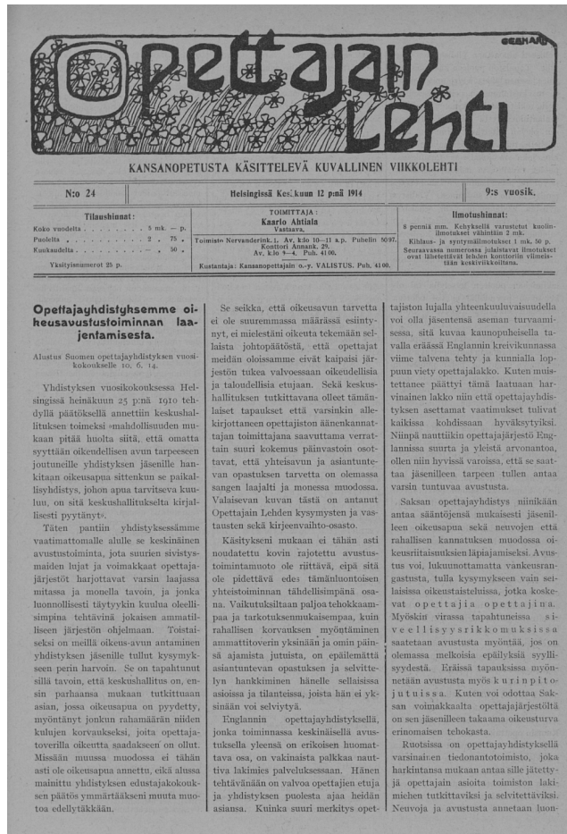
Kuva 1. Oikeusapukysymys Opettajain Lehden etusivulla 12.6.1914.

roista 2 hakusanalla ”oikeusapu” 1890–1920-luvuilta kaikki kirjoitukset, joissa käsiteltiin oikeusapukysymystä. Sisällönanalyyseissä kiinnitettiin huomiota muun muassa siihen, millaisia näkökulmia kirjoituksissa nostettiin esille, millä seikoilla oikeusaputoiminnan käynnistämistä perusteltiin ja miten suhtautuminen oikeusapuun muuttui tarkasteluajanjakson kuluessa. Nämä havainnot kytketään laajempaan yhteiskunnalliseen ja oikeudelliseen kontekstiin.