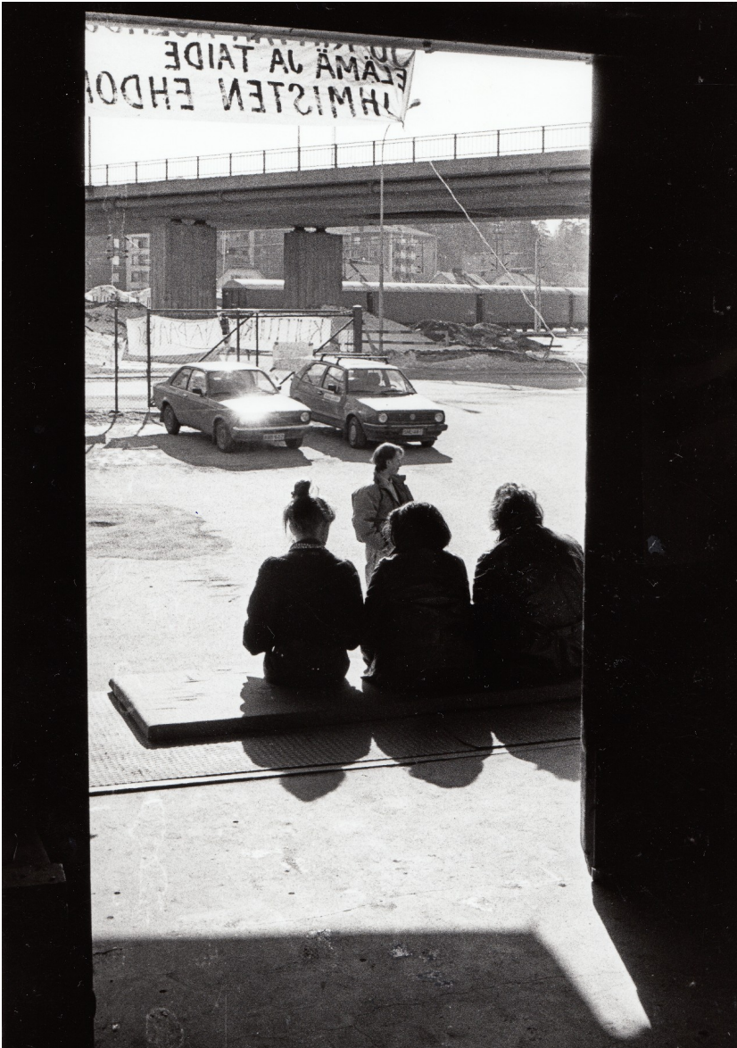
Kuva 2. Pohjois-Karjalan museo, Karjalan Maa -lehden kuvakokoelma, 1989.

Talonvaltaajien tummat, siluettimaiset hahmot nousevat esiin valokuvasta omana ryhmänä. (Kuva 2.) Anonyymeiksi jäävät nuoret istuvat vallatun rakennuksen ulkopuolella. Valokuva tuottaa tunnelman havainnon kohdistumisesta rakennuksen sisältä ulospäin. Arvoituksellinen kuvakulma ei paljasta tietoa talonvaltaajien mahdollisista tavoitteista tai tapahtumista rakennuksen sisällä. Bourdieu (1998, 43–44) kuvaa sosiaalisen tilan olevan joukko toistensa suhteen määrittäviä asemia. Valokuvan esittämässä näkymässä keskeisiä elementtejä ovat talonvaltaajat ja taustalla näkyvä urbaani kaupunkimaisema. Valittu näkökulma asemoi nuoret kiinteistön rajalle, minkä tulkitsemme edustavan talonvaltaajien ja ympäröivän yhteiskunnan välistä suhdetta. Sosiaalisessa tilassa omaehtoinen talonvaltaus