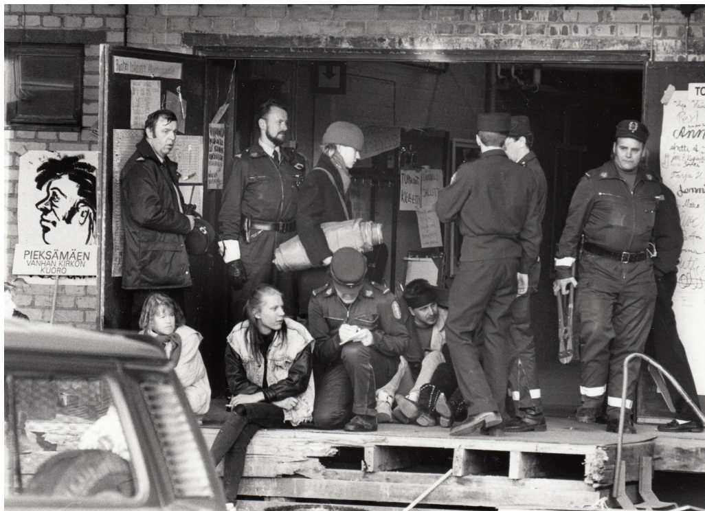
Kuva 4. Pohjois-Karjalan museo, Viikko Pohjois-Karjala -lehden kuvakokoelma, 1989.

Kulttuuribunkkerin valtaus esitetään paikkana, jonka voidaan tulkita myös rajoittavan valtaukseseen osallistuvia. Nuorten ja viranomaispukuisten näkemykset ja kokemukset talonvaltauksesta paikkana voivat olla keskenään erilaisia (ks. Gieryn 2000, 464–466, 472; Hyvärinen 2014, 16). Talonvaltauksesta on sanottu, että se nähdään usein julkisen vallan näkökulmasta häiriköintinä (ks. Simonen 2008, 43; Wallin 2008, 9). Valokuvan välittämä näennäisen rauhallinen tunnelma haastaa edellä esittämäämme käsitystä, mutta samanaikaisesti viranomaispukuisten aikuisten toiminta kuvaustilanteessa ilmentää ristiriitaisuutta. Nuorten organisoima talonvaltaus representoi uhkaa ja ongelmaa, joka ratkeaa, kun aikuisia edustavat viranomaiset puuttuvat valtauksen kulkuun (ks. Aapola & Kaarinen 2003, 17). Itsenäisesti toimineet talonvaltaajanuoret esitetään myös valokuvan perusteella huolenpitoa tarvitsevinä.