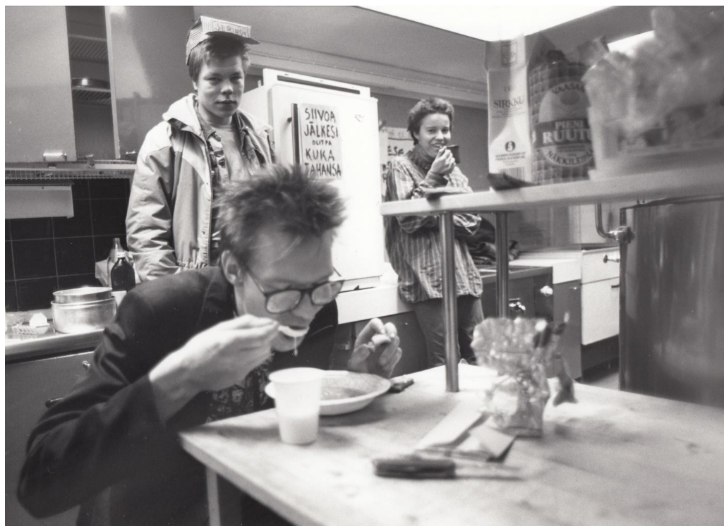
Kuva 5. Pohjois-Karjalan museo, Viikko Pohjois-Karjala -lehden kuvakokoelma, 1989.

Myös vallatun kiinteistön keittiössä aikaa viettävät nuoret edustavat tavanomaisuutta ja arkisuutta. (Kuva 5.) Etualalla yksi henkilö istuu syömässä. Kuvan voi tulkita edustavan talonvaltauksen paikan yhteisöllisyyttä ja tarpeellisuutta siihen osallistuville. Talonvaltaajien kiinteistöön sijoittamat tekstit vahvistavat valokuvassa rakentuvaa näkymää talonvaltauksesta paikkana. Esimerkiksi jääkaapin ovesa lukee ”Siivoa jälkesi, olitpa kuka tahansa”. Yhdellä talonvaltaajista on päässään pahvista tehty, ”serihvi”-tekstillä varustettu hattu, jonka voi tulkita piikittelevän lempeästi lainvalvonnalle ja välillisesti kyseenalaistavan kontrollin pakollisuuden valokuvassa ilmenevän rauhallisen tunnelman myötä.