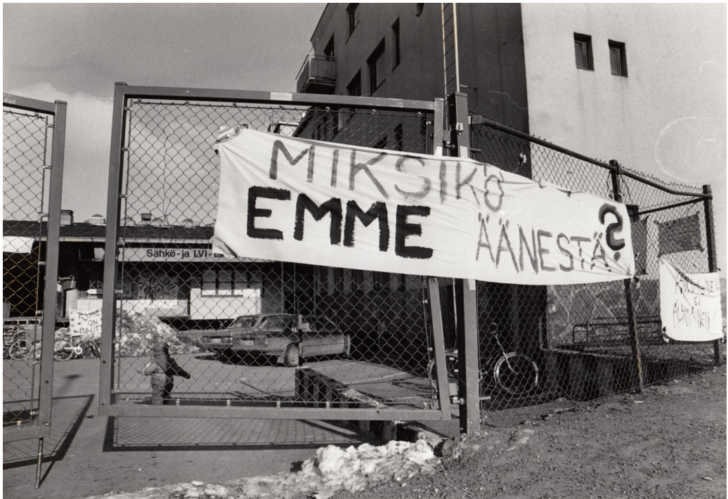
Kuva 6.