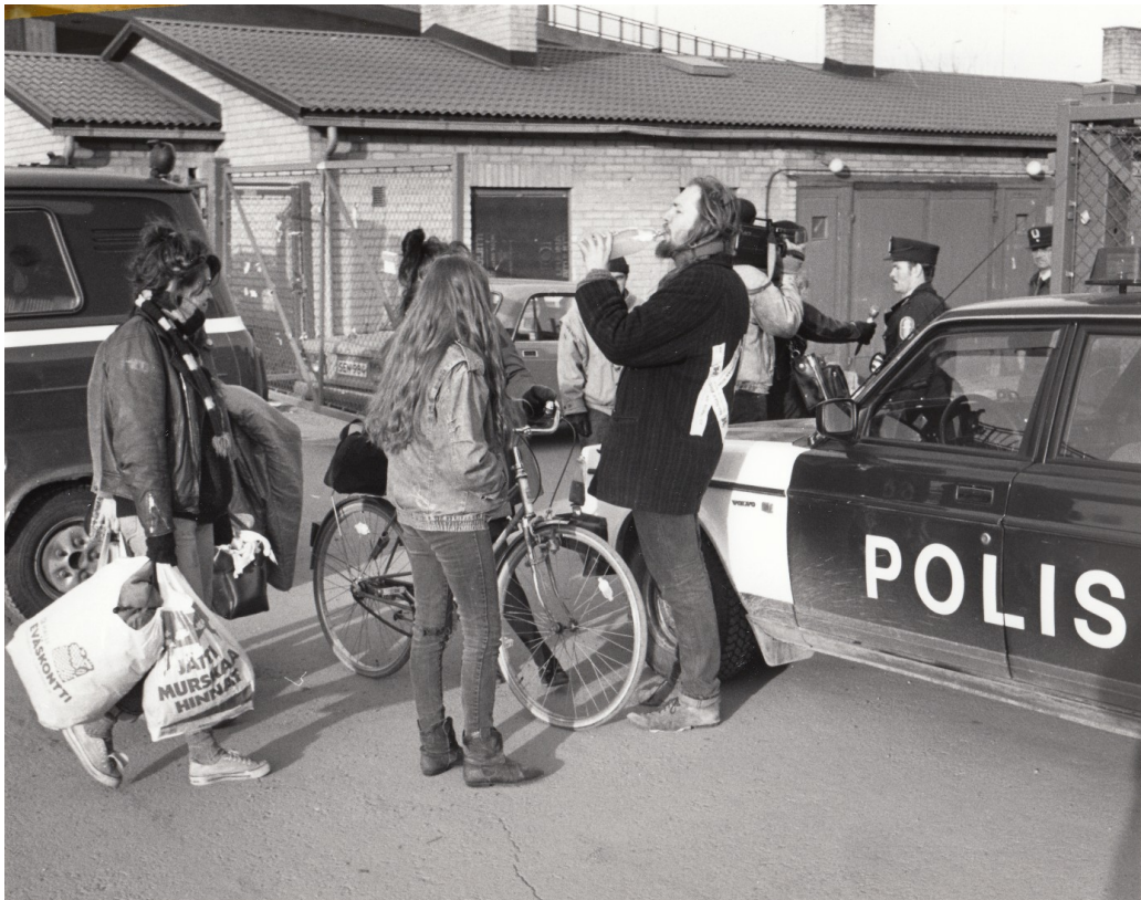
Kuva 7. Pohjois-Karjalan museo, Viikko Pohjois-Karjala -lehden kuvakokoelma, 1989.

Valokuvien merkitys ei rajoitu vain kyseiseen talonvaltaukseseen, vaan siihen vaikuttavat myös valokuvien joustavat käyttök kontekstit. Kulttuuribunkkeri esiintyy valokuvissa symbolina laajemmalle nuoruuteen liittyvälle symboliselle kamppailulle. Nuoruuden normit rikkoutuvat talonvaltaustoiminnassa (ks. esim. Elder & Giele 2009, 23), ja valokuvat tekevät näkyväksi ympäröivän yhteiskunnan reaktioita talonvaltaukseseen symbolisen kamppailun kiihtyessä. Kulttuuribunkkeri esitetään valokuvissa kentänä, jolla on merkitystä sekä talonvaltaajille itselleen että ympäröivälle yhteiskunnalle. Talonvaltaus uhkaa sosiaalisten jakojen pysyvyyttä, ja kenttä järjestäytyy toistuvasti uusiin asetelmiin. Valokuvissa esitetyt viranomaiset tekevät työtään ja toimivat määrätietoisesti vaikuttaakseen talonvaltaukseseen.