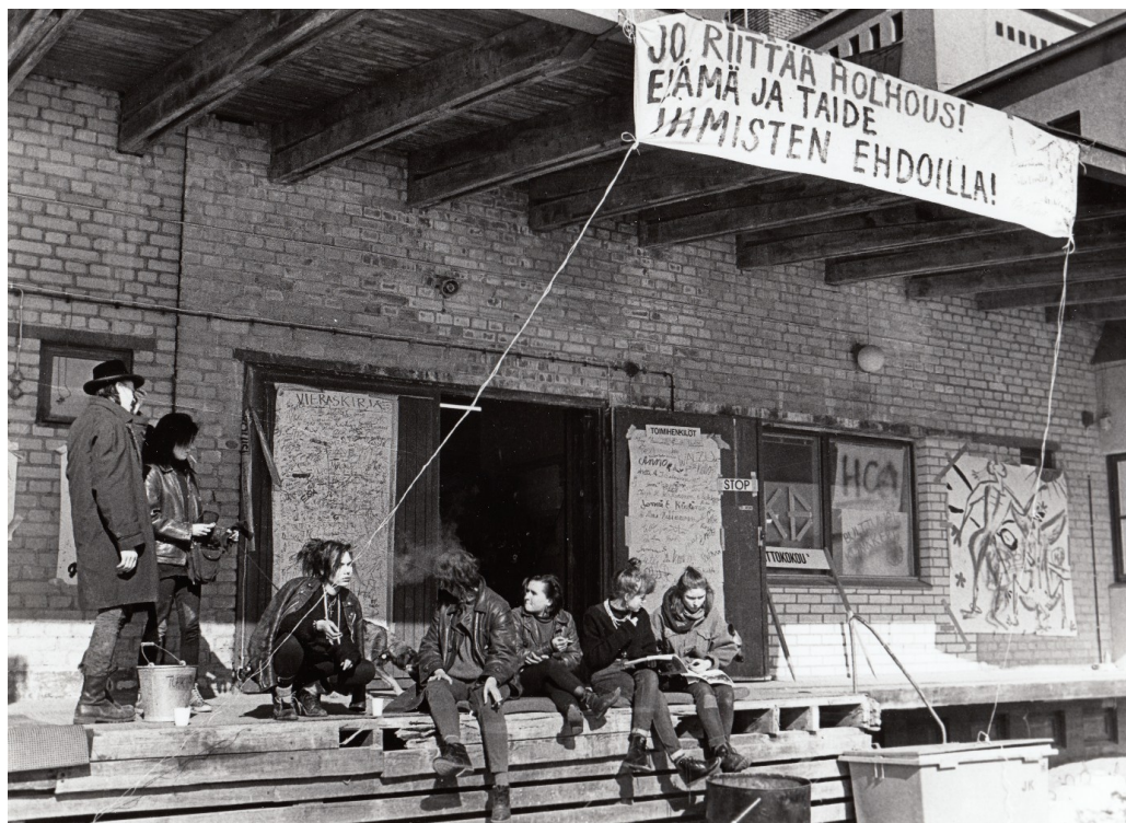
Kuva 1. Pohjois-Karjalan museo, Karjalan Maa -lehden kuvakokoelma, 1989.

Tulkitsimme valokuvaa nähden sen esityksenä: banderollin tekstin voi sanoa kuvastavan tyytymättömyyttä yhteiskunnalliseen tilanteeseen ja tekevän näkyväksi talonvaltauksen tavoitteita. Talonvaltaustoiminta tilana edustaa näin vaatimusta ja mahdollisuutta muutokseen (Bourdieu 1998, 43–44). Myös tutkimuksissa on esitetty, että talonvaltaajilla on pyrkiä edistää tavoitteitaan ja tarpeitaan sekä saada itselleen käyttöön muuten saavuttamattomissa olevaa, kontrolloimattomaksi koettua tilaa (Luhtakallio 2008, 41; Vapaa Helsinki -kollektiivi 2008; Wallin 2008, 9–10).