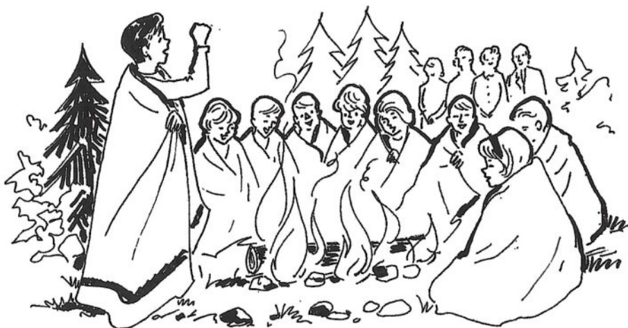
Kuva 3. (Uusi Kerhokirja, 1964, 273.) Piirros: Maarit Larva.