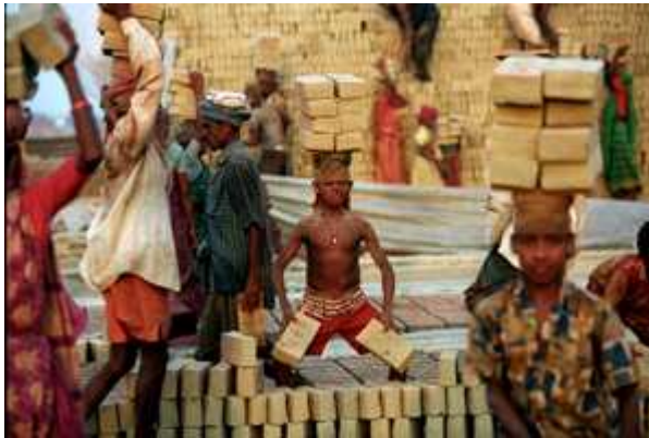
Kuva 5. UNICEFin (2007) sponsoroimassa ”vuoden valokuva” -kilpailussa toiseksi tulut otos.

Oikeutta kenelle ja kenen lapsuutta tukemassa? - Lapsen oikeuksien sopimuksen 12. artiklaa, ns. osallisuuspykälää, on käytetty ahkerasti viimeaikaisen lapsi- ja nuorisopolitiikan suuntaamisessa ”osallistavampaan” suuntaan. Artiklan mukaan lapsella, joka kykenee muodostamaan omat näkemyksensä, on oikeus ilmaista vapaasti nämä näkemyksensä kaikissa itseään koskevissa asioissa. Sopimuksen mukaan lapsen näkemykset tulee ottaa huomioon hänen ikänsä ja kehitystason mukaisesti. Tämän toteuttamiseksi lapselle on annettava mahdollisuus tulla kuulluksi häntä koskevissa oikeudellisissa ja hallinnollisissa toimitissa joko suoraan tai edustajan/asianomaisen toimielimen välityksellä, kansallisen lainsäädännön menettelytapojen mukaisesti.