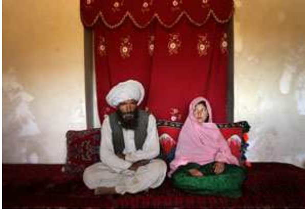
Kuva 4. UNICEFin (2007) sponsoroiman ”vuoden valokuva” -kilpailun voittaja vuodelta 2007.