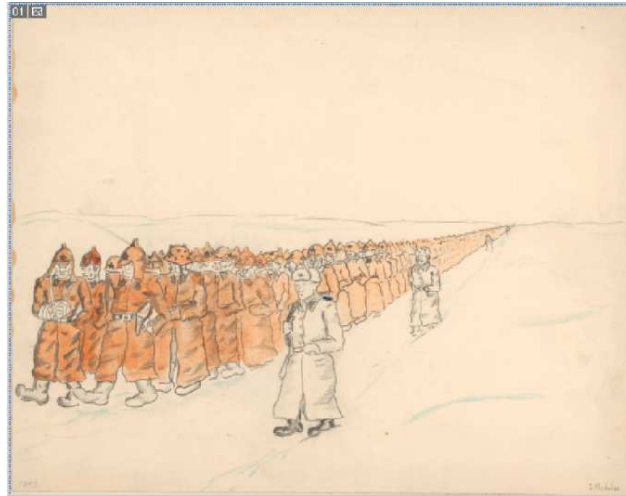
Kuva 3: Sota-ajan perspektiivioppiä. Stig Nyholm, Tehtaanpuiston yhteiskoulu 1940-luku.

Naisten ja miesten työt erottuvat selvästi kuvissa, myös lapset kuvattiin työnteossa eikä leikkimässä (kuva 4.) Rompun sota-ajan luokassa olevasta tytöstä kertova Mirjan tarina pohjautuu historiaprojektin opiskelijan sukulaisen sota-ajan päiväkirjaan ja perheen valokuva-albumien kuviin. Suomalaisuus on tärkeä teema, josta on oma tarinansa myös tässä luokassa. Radiosta opettajanpöydällä suunniteltiin kuunneltavaksi ajan radiolähetyksiä.