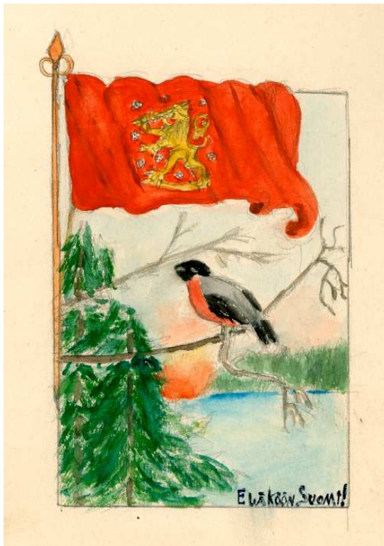
Kuva 2. Eläkön Suomi 1917. Vieno Virtanen VB. Helsingin Suomalainen Tyttökoulu.

Ensimmäisen luokan kuvissa näkyy koulun tärkeä tehtävä rakentaa suomalaisuutta ja kansakuntaa visuaalisten symbolien avulla oppilaiden tietoisuuteen. (Kuva 2.)