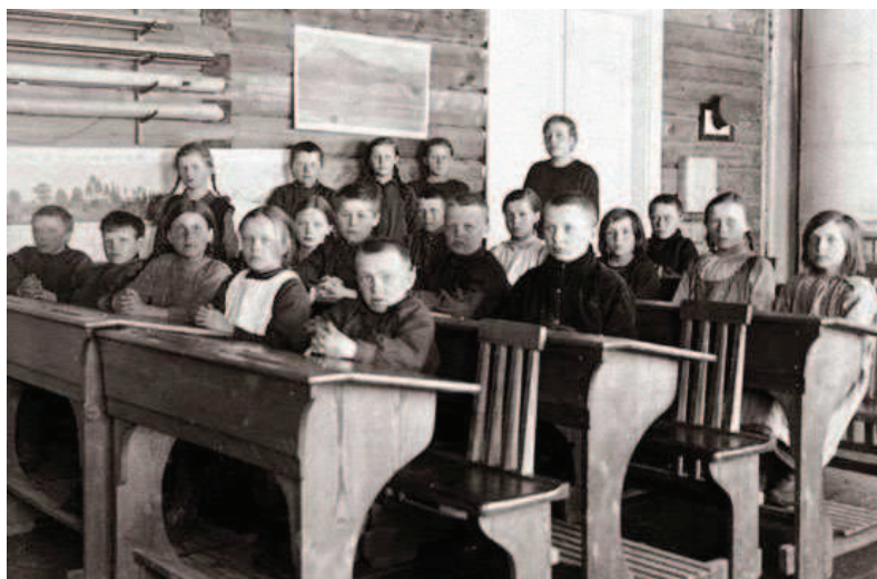
Sodankylän Torvisen kansakoulun oppilaita joskus vuosien 1924–26 välillä.