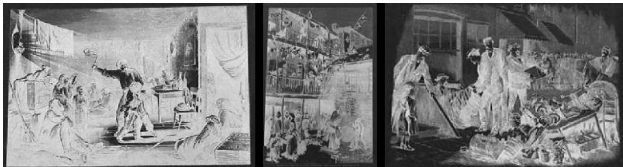
Filantropian taustalla on puutteellinen sosiaaliturva. Lehdet välittivät kurjuuden kuvia hyvinvoivien koteihin: Isä pahoinpitelee lastaan (vas.). Elämää vuokrakasarmissa (kesk.). Häätö (oik.).