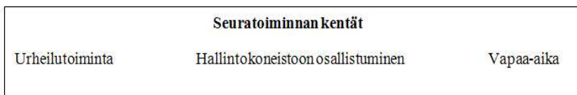
Kuvio 1. Tutkimusmallin ylin taso

Urheilutoimintaan sisältyy harjoituksissa ja kilpailuissa sekä niiden yhteydessä vietetty aika. Urheilutoiminnan lisäksi seura vaatii toimiakseen, että sen jäsenet – tai ainakin osa heistä – osallistuu päätöksentekoon, seuratoiminnan pyörittämiseen ja seuran suunnan määrittämiseen. Seuran johto on viime kädessä vastuussa siitä poliittisesta suunnasta, jota seura edustaa. Koska seura on demokraattinen organisaatio, on seuran jäsenillä huomattava ellei jopa suurin vaikutus sen poliittiseen suuntaan. Johtokunnan on tehtävä päätelmänsä jäsenistön edustamien ja ajamien aatteiden pohjalta, ja näillä tiedoilla muokattava seuran poliittis-