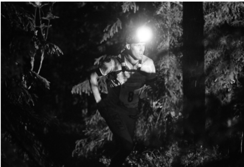
Tätä Jukola voi myös olla parhaimmillaan; yksinäinen suunnistaja, lamppu ja ympäröivä pimeä metsä.

Jukolan viestissä on tänä päivänä monia vahvuuksia. Ensinnäkin Jukola kiertää ympäri maata ja saa joka vuosi uudet motivoituneet järjestäjät, eikä leipääntymistä pääse tapahtumaan. Toisaalta Jukolalla on vahva ja hyvin toimiva johtojärjestelmä ja johtoryhmä. Näin viestin järjestämistä ei tarvitse opetella joka vuosi alusta alkaen uudelleen. Myös Jukolan hyvä maine voidaan nähdä vahvuutena. Kilpailulla on näkyvyyttä ja se on haluttu tapahtuma järjestää. Perinteet ja arvojen kunnioittaminen on myös ehdottomasti nähtävä vahvuuksina. Lisäksi Kaukametsäläisten rooli perinteiden vaalijana on tärkeää, ja sillä on vain positiivista vaikutusta kilpailulle. Jukola on tunnettu korkeasta laadustaan. Se herättää kiinnostusta – ympäri maailmaa – tulla kokemaan Jukolan maaginen yö. (Reimo Uljaksen haastattelu 15.10.2009.)