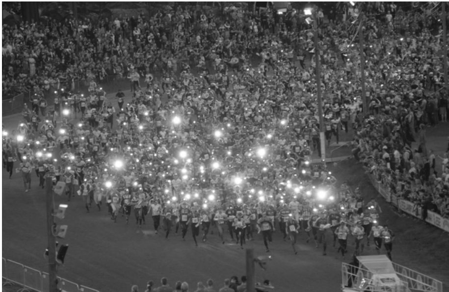
Jukolan viestin lähtö asettaa kilpailukeskukselle omat vaatimuksensa. Kuvassa Mikkelin 2009 Jukolan lähtö Mikkelin raviradalla.