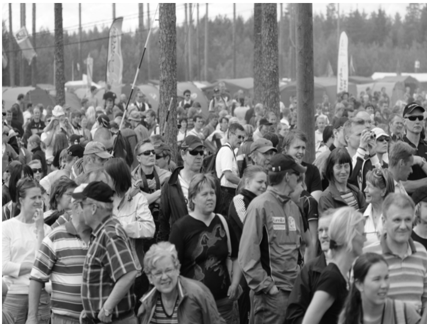
Jukolan viestin kilpailukeskuksessa väkeä ja vilinää riittää. Kuvassa Tampereen Jukolan 2008 yleisöä.

kuet tavoittelevat tosissaan kilpailun voittoa, kuntosuunnistajat maaliin pääsyä ja oman radan suorittamista.