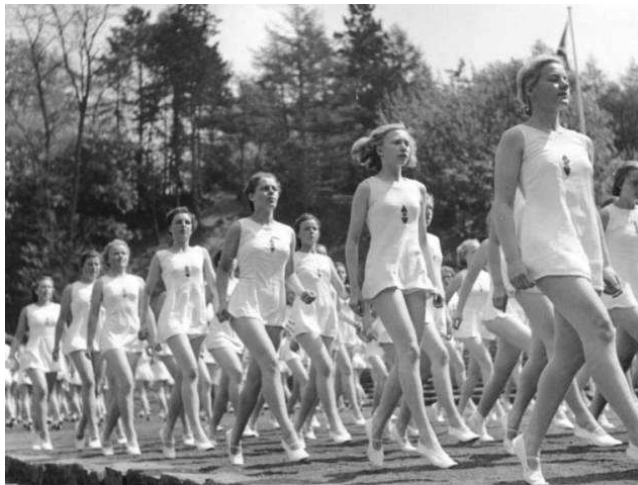
Aatteen puolesta. Bund Deutscher Mädel -voimistelijoita kulkueessa vuonna 1941.