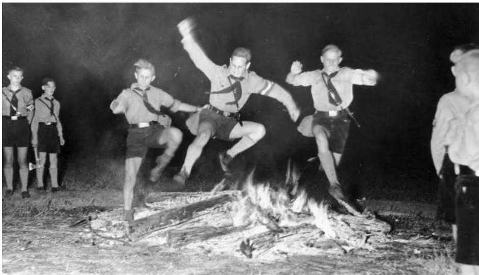
Terästä karkaisemassa. Berliinin Hitler Jugend juhlii kesäpäivänseisausta vuonna 1937. Nuotion yli hyppääminen oli osa juhlaperinnettä.

kasvatus oli ennen kaikkea massojen kasvatusta. Uinti, hiihtäminen, vaeltaminen ja yleisurheilu olivat tämän vaiheen urheilulajeja. Toisen tason Baeumlerin systematiikassa muodostivat lajit, joiden harrastamiseen liittyi vaaroja. Tämän tason lajeja olivat eri kamppailulajit, mutta myös joukkueurheilun eri lajit (Mannschaft). Kolmannen tason muodosti olympiaurheilu, joka harrastajamäärältään oli vähäinen. Tämänkään tason perusta ei ollut yksilösuorituksissa, vaan kansanelämässä (in der Sphäre volkstümliche Lebens). (Baeumler 1934a, 175; Baeumler 1934b, 183; Baeumler 1937, 225–226.)