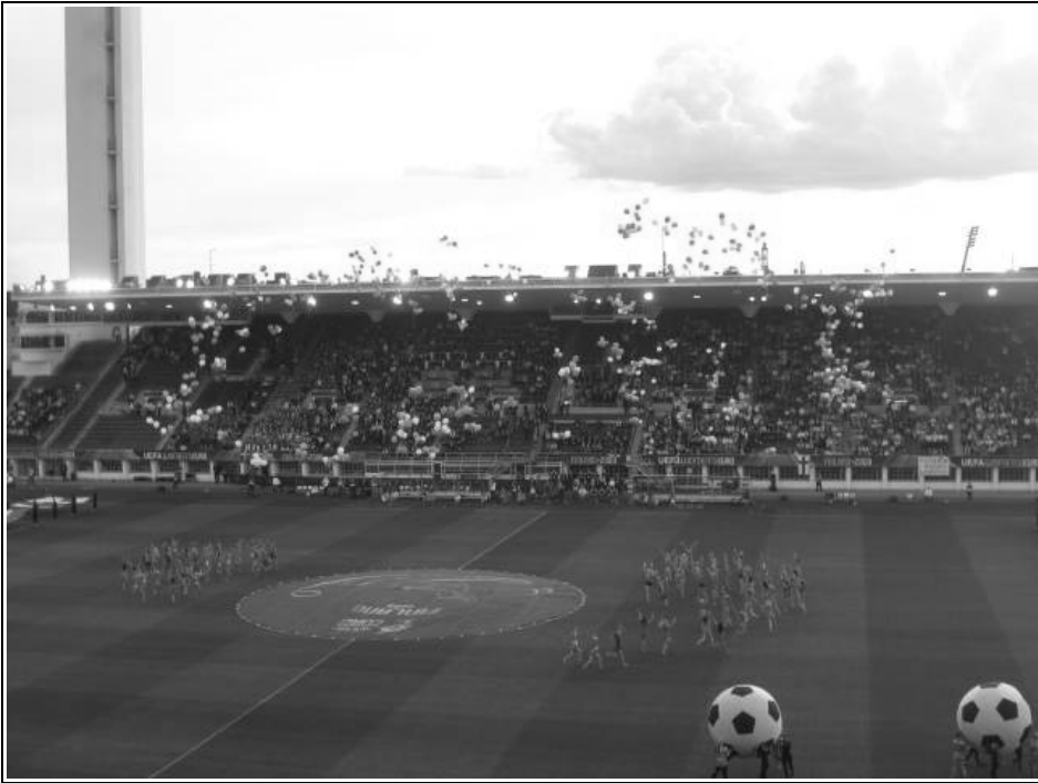
Naisten EM-kisat näyttäytyivät iloisena arvokisatapahtumana.

Kun mietin kisoista välitettyjä kuvia, mieleeni tulee lähinnä vauhdikkaita tilanteita ottelun tuoksinasta tai juhlivia pelaajia. Sekä televisiosta että etenkin paikan päältä otteluista jäi erittäin hyvät muistot. Ajattelin, että tämä on urheilujuhlaa parhaimmillaan! Tunnelma oli todella lämmin, positiivinen ja kannustava viimeiseen minuuttiin asti ja esimerkiksi Suomi–Englanti -matsissa yleisö sai todella kokea oikein elämysten kirjjon. Yleisöstä puuttuivat miesten matseista tutut puolihumalaiset besserwisserit ja tuomion profeetat ja ylipäätään koko negatiivis-aggressiivinen asenne. [28]