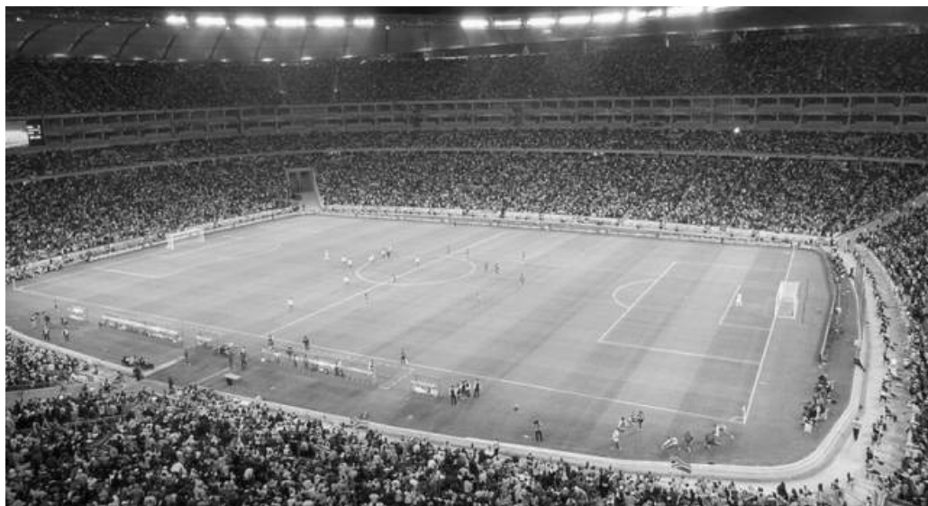
Etelä-Afrikassa pidettävien kisojen loppuottelun näyttämö: Soccer City -stadion.

vuoden 2010 MM-lopputurnauksen lyhyt- ja pitkäaikaiset vaikutukset ovat sekä poliittisesti että tutkimuksellisesti kiinnostavia. Muutaman vuoden kuluttua tiedämme enemmän kisojen todellisista vaikutuksista isäntämaan ja -maanosan kehitykseen ja arkipäivään.