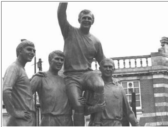
Elämää suurempi voitto pronssiin valettuna. Henkilöt vasemmalta lukien: Geoff Hurst, Martin Peters, Bobby Moore (olkapäällä) ja Ray Wilson.