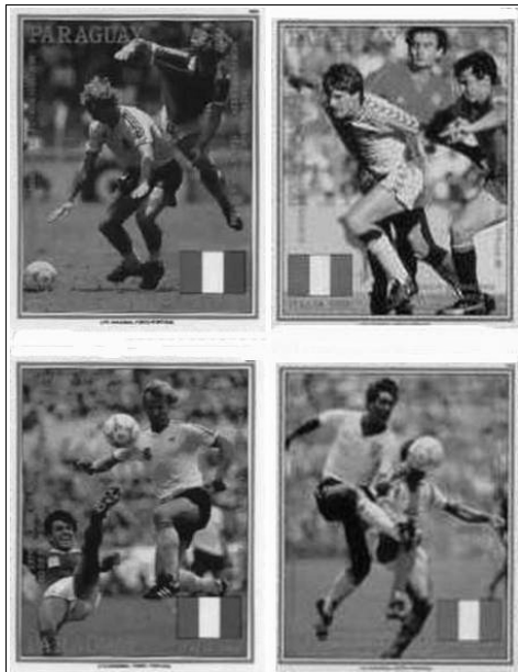
Paraguay julkaisi vuoden 1986 kisoista oman postimerkkisarjansa.

Epäilyksistä ja amerikkalaisyleisön ajoittain näkyneestä asiantuntemattomuudesta huolimatta kisat onnistuivat yli odotusten. Isoilla stadioneilla pelatut ottelut keräsivät ennätysyleisön, keskimäärin lähes 69 000 katsojaa ottelua kohti, ja peli oli sääntö- ja taktiikka-muutosten ansiosta vauhdikkaampaa ja tilaanteikkaampaa kuin neljä vuotta aikaisemmin. Myös maaleja tehtiin enemmän. Kisat olivat merkittävä virstanpylväs MM-lopputurnauksen historiassa, mutta silti miesten jalkapalloilu ei juurtunut Yhdysvaltioihin lujasti – ei vaikka isäntäjoukkue pelasi erinomaisesti ja selviytyi alkulohkostaan jatkoon. (Lahtinen ym. 1994b.) Kuvaavaa on, että Etelä-Afrikan lopputurnaukseen nimetystä Yhdysvaltain joukkueesta vain muutama pelaaja palloilee kotimaansa uudelleen käynnistyneessä liigassa (Fifa 2010e). Toisaalta voi myös arvioida, että Yhdysvaltojen ja erityisesti sen suurten televisioyhtiöiden olematon vaikutus jalkapalloiluun on ollut lajin kannalta onni. Ennen Yhdysvalloissa pelattua lopputurnausta nostettiin näet esille useita sääntöuudistuksia, esimerkiksi peliajan uutta rytmittämistä ja maalin suurentamista, jotka olisivat palvelleet tele-