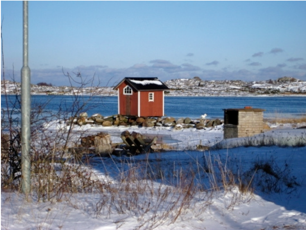
Sukupolvien välistä kerrontaperinnettä yritetään elvyttää Turun saaristossa yhteisten kohtaamispaikkojen luomisella. Velkuan ja Utön (kuvassa) koulut osallistuiivat hankkeeseen.

Toisessa tapaamisessa vanhukset eivät olleet mukana. Sen sijaan oppitunnille osallistui vieraina Utön koululaiset. Edellisellä kerralla kerättyjen kertomusten pohjalta työskenneltiin tekemällä pareittain ja ryhmissä tehtäviä. Yläkouluikäiset pojat saivat toisella tapaamisella kirjoitustehtävän, jota heidän suomenkielen opettajansa oli esittänyt. Pojat kirjoittivat yhden edellisellä kerralla kuulemansa tarinan uudelleen. Tehtävänantoon kuului se, että tarina ”kännettiin” omalle kielelle eikä oikeinkirjoitussääntöjä tarvinnut noudattaa. Materiaalina sai käyttää myös kirjoitettuja vanhoja velkualaistarinoita. Kertomuksista tuli eläviä ja humoristisia.