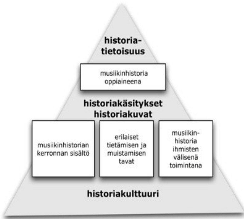
Kuva 2: Musiikinhistorian opettaminen ja opiskelu historiakulttuurin osana (Unkari-Virtanen 2009, 21).

ihmisten arkiset käsitykset (ks. van den Berg 2007, 43–45; Kalela 2000, 65–67). Historia-kulttuuri tuottaa historiakäsityksiä ja historiatietoisuutta, kuten kuva 2 esittää. Ihmiset ammentavat historiakulttuurin tarjoamista mahdollisuuksista historiakäsityksensä, jotka voivat olla Hentilän mukaan tietoisia tai tiedostamattomia (Hentilä 2001, 32–33).