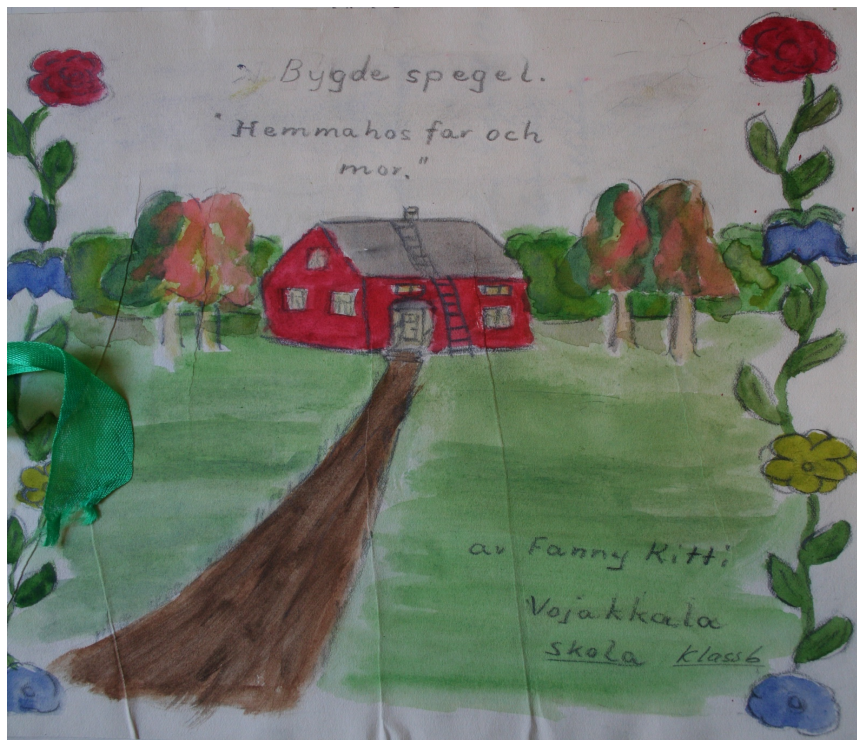
Kuva 5. Fanny Ritti, 6.lk. Vojakkala