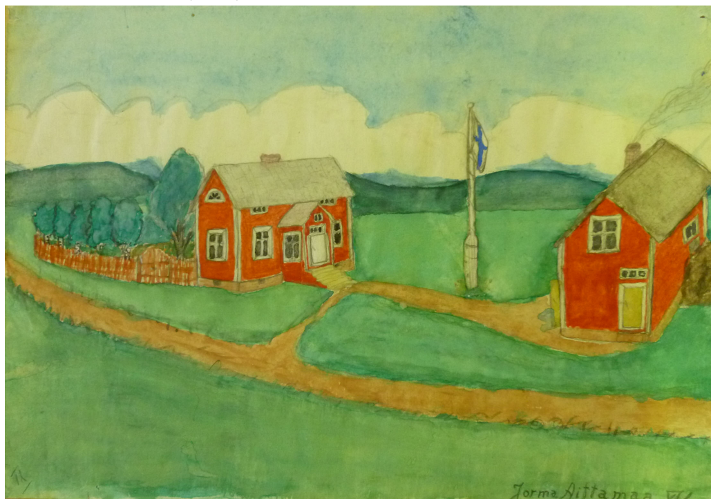
Kuva 3. Jorma Aittamaa, 13 v., Ylitornio