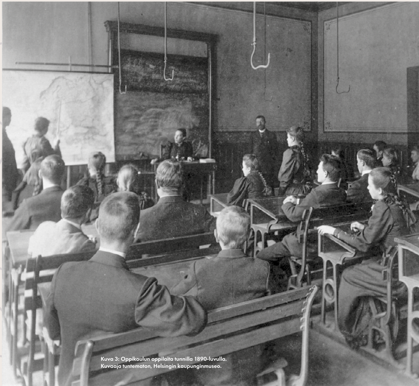
Kuva 3: Oppikoulun oppilaita tunnilla 1890-luvulla.