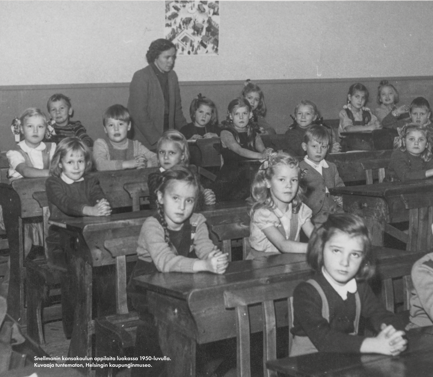
Snellmanin kansakoulun oppilaita luokassa 1950-luvulla.