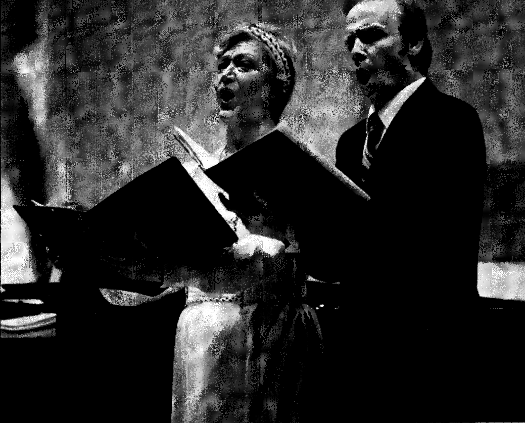
Kaksi riveistämme kohonnutta, maailmanmaineeseen yltänyttä laulajatähteä, Ritva Auvinen ja Jorma Hynninen. Kuva on opettajien kulttuuripäiviltä 1984.

joittavat taidettaan oman työnsä ohessa kotikunnassaan ja -maakunnassaan ympäristönsä iloksi.