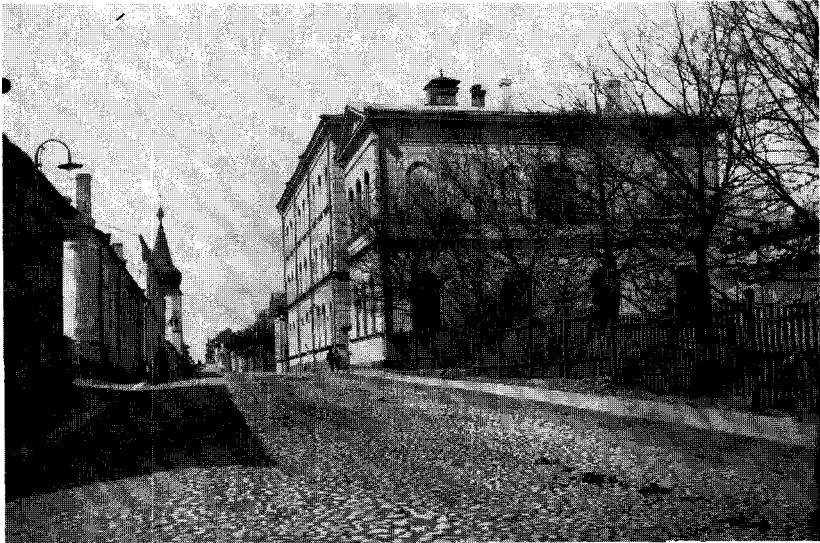
Viipurin ruotsalainen yhteislyseo.

Suomenkielinen oppikoulu kehittyi 1870-luvulta alkaen kahdella linjalla (Viipurin reaalikoulu → Viipurin alkeiskoulu → Viipurin suomalainen reaalilyseo ja Viipurin suomalainen yksityislyseo → Viipurin klassillinen lyseo). Oppilastulva pakotti vähitellen perustamaan lisää oppikouluja, niistä osa yhteiskouluina; ensimmäisenä alkoi toimintansa Viipurin yhteiskoulu 1898. Vuonna 1881 syntyi Viipurin suomalainen tyttökoulu, josta kehittyi Viipurin tyttölyseo 1925. Aiheemme kannalta ei ole tarpeen tarkemmin selostaa 1920- ja 1930-luvun laajenevaa suomenkielistä oppikoulutoimintaa.