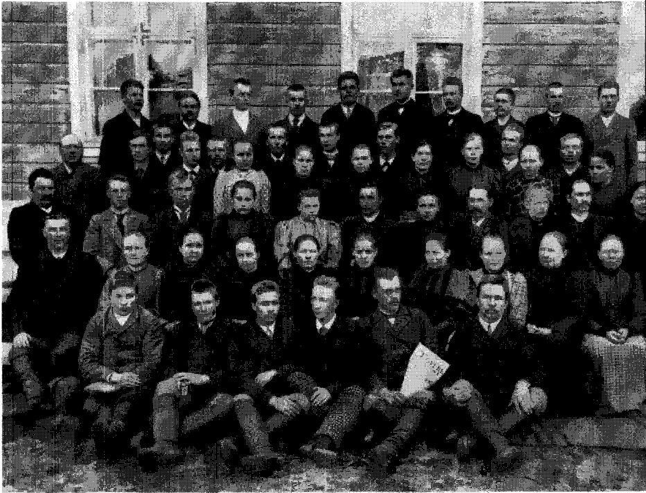
Pohjois-Savon eli Koivumäen kansanopiston ensimmäiset oppilaat Maaningan Hollolan kartanossa lukuvuonna 1895–96.

sallisen ajattelun levittäminen myös maalaisväestön keskuuteen sai uuden merkityksen.