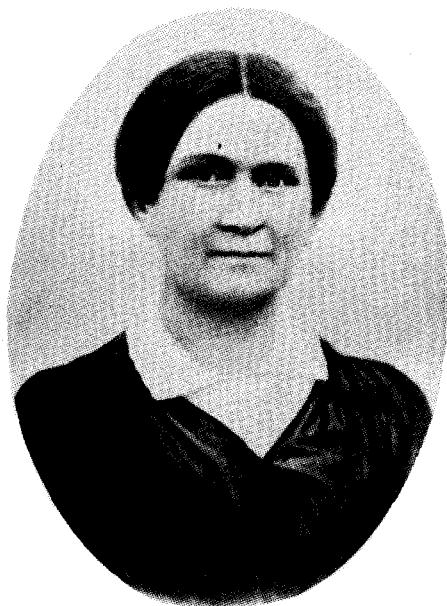
Fredrika Runeberg.

Lukemaan ja kirjoittamaan Fredrika oppi omin avuin. Hänellä oli jo varhain tapana lukea äidilleen ja isolle siskolleen, kun he ompelivat. Lukusilla hän selviytyi helposti katekismuskuulustelusta.