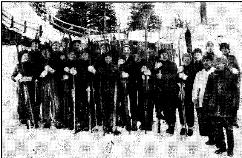
Talvisin hiihto- ja mäenlasku olivat sotilaspoikien suosituimpia liikuntalajeja. Ylläolevassa kuvassa on innokas joukko lahtelaisia sotilaspoikia Heinolan hyppyrimäellä harjoittelemassa poikatyönjohtajien johdolla.