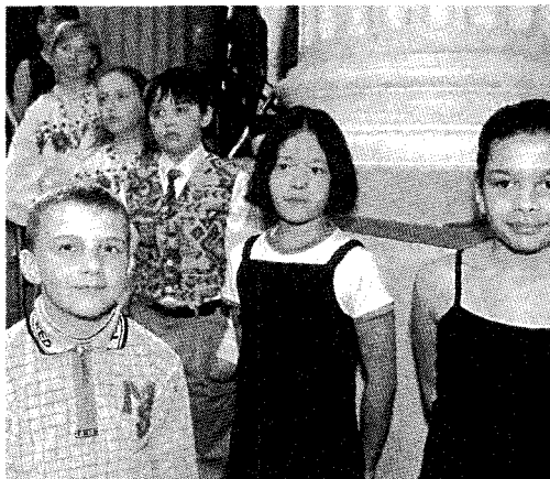
Monikulttuurisia oppilaita 80-vuotta oppivelvollisuutta pääjuhlassa 2001 Helsingissä

Muinaisen Ateenan strategilta Perikleeltä tiedusteltiin, miten on mahdollista, että silloisen maailman etevimmät filosofit, kirjailijat, taiteilijat ja lainsäätäjät ovat kaikki ateenalaisia. Perikleen vastaus oli yksinkertainen: ”Ainoakaan lahjakas nuorukainen ei jää meiltä huomaamatta”. Nykyaikainen vastaus kuuluisi: ainoakaan lapsi tai nuori ei jää huomaamatta. Tämä tarkoittaa huolenpitoa myös erityistä tukea tarvitsevista, myös siitä ikäluokan viimeisestä neljänneksestä, jolle peruskoulu tuottaa vaikeuksia.