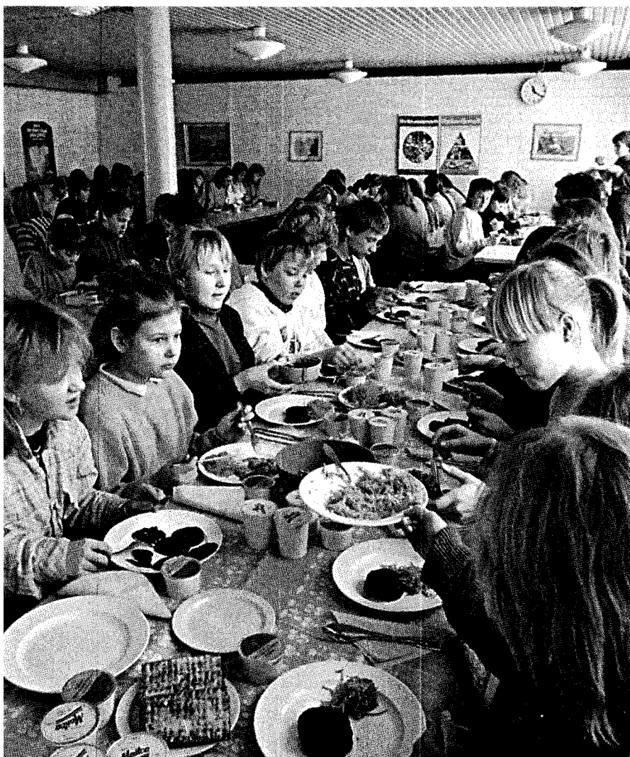
Suomalais-venäläinen koulu 1980-luku, Helsinki

tänyt enää tyydyttävän kaikkien sivistystarvetta. Opettajan tärkeäksi tehtäväksi tuli oppilaidensa valmistaminen pääsytutkintoon. Kansakouluun jääneiden opettaminen on saattanut olla turhauttavaakin. Oppikoulun opettajien ongelmaksi puolestaan muodostui entistä epätasaisempi oppilasaines entistä suuremmissa luokissa. Toisaalta taas luokalle jäämiset ja koulusta eroamisesta lisääntyivät. Kun lisäksi oppikoulu ei maantieteelliskään ollut kaikkien saavutettavissa, koulujärjestelmän perusteellinen uudistaminen tuli ajankohtaiseksi.