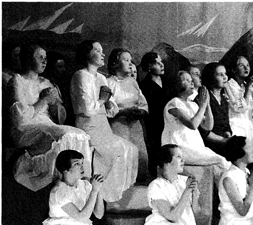
Riihimäen jatkokoulun oppilaiden lausuntakuoro 1936

Non scholae sed vitae discimus , emme opi koulua vaan elämää varten – tätä hokemaa sai omana kouluajanani vuosisadan puolivälissä kuulla lähes kyllästymiseen asti. Harva siltikään kertoi, mitä se elämä olisi, ja vielä vähemmän kerrottiin, mitkä koulun tiedoista ja taidoista olisivat elämässä todella tarpeen. Käytännössä olen kuitenkin tullut koko hyvin toimeen juuri koulun an-