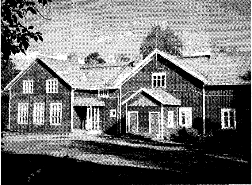
Isojoen Heikkilänkylän koulu syksyllä 2003.

ne itse. 16 Valtio alkoi myöntää tukea varattomien oppilaiden kirjahan- kintoihin vuonna 1895. 17