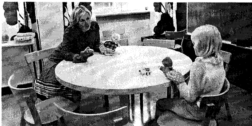
Pienin opetusryhmä erityisopetuksessa voi olla yksi oppilas, jollaisia on lukiopetuksessa ja puheen korjaustunneilla. Kuva otettu koulujen äänihäiriöpoliklinikalla vuonna 1978

puheopettajien määrää hiljalleen pääkaupungin koulubudjetin niin salliessa. Vuonna 1967 perustettiin Helsingin kansakoulujen puhe- ja äänihäiriöiden poliklinikka, jonka johtoon valittiin foniatriilääkäri ja vuonna 1973 työntekijöinä oli jo kahdeksan puheterapeuttia. (Somerkivi 1977, 164–166) Peruskoulun ensimmäisinä lukuvuosina puheopettajia valittiin lisää ja heidän määränsä oli syksyllä 1980 Helsingin peruskouluissa 15 opettajaa. (Helsingin kaupungin koulu- laitoksen vuosikertomukset 1980, 19)