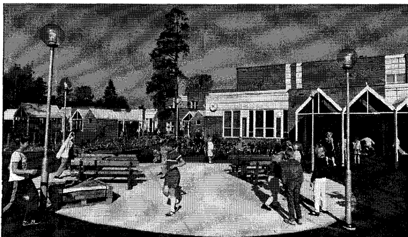
Yksi Helsingin kymmenistä sodan jälkeen rakennetuista moderneista koulurakennuksista, Nurkkatien ala-aste Puistolon kaupunginosassa

Ajatusta uudesta yhtenäiskoulusta ryhdyttiin pohtimaan jo 1950-luvulla. Varsinkin oppikoulupiireissä se kohtasi vastustusta, mutta vähitellen se sai kannatusta yhä laajemmissa piireissä. Alettiin valmistella uutta lakia peruskoulusta. Myöhemmin seurasivat lukion ja keskiasteen uudistus.