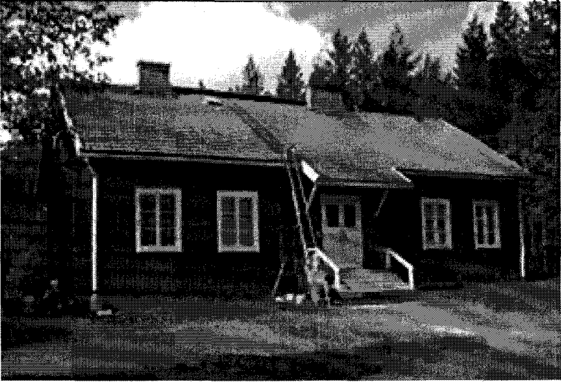
Kuva 2. Saunajärven koulun asuntola ennätti olla v. 1949–1970 noin parin sadan oppilaan koulukotina. (Kuva Seppo Hyyrö 2007.)

mitä heillä mahd. kotona onkaan ja että he myös samalla jotakin oppivat. Kaikenlaiset “salaseurat” kerhot ovat asuntolassa luvallisia kun ne eivät häiritse talon toimintaa ja kotitehtävien tekoa. Asuntolassa toimitetaan koulun omaa lehteä op:n valvonnassa. Ilmestyy kerran viikossa”. (KKSaKo III 13:6 Dc ja Db.)