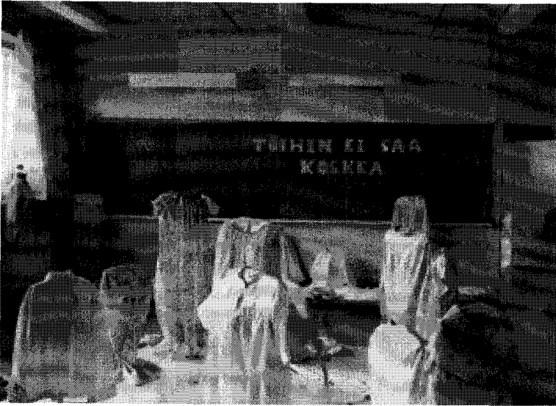
KUVA 5. Tyttöjen käsitöitä Someron kansalaiskoulun kevät-näyttelyssä.

Kansalaiskoulu oli merkinnyt vuosikymmenien unelman täyttymistä. Maan erinomainen kansakoulu oli saanut täydennyksekseen mallikelpoisen jatko-opetuksen. Koulun kehittämisspyrkimysten kiihdyttyä sotien jälkeen kansalaiskoulun idea alkoi kuitenkin viitata pikemminkin menneisiin utopioihin kuin uudistajien visioihin. Uusi jatko-opetusmuoto jäi koulunuudistusspyrkimysten varjoon, miltei näkymättömäksi. Sitä pidettiin väli-vaiheena, tilapäisenä apurakennelmana, peruskouluun siirryttäessä. Matalan profiilin koulumuotona se kuitenkin kasvatti nuorisoa yhteiskuntaan ja työelämään – ja hyvin tuloksin, vaikka virallisten arviointien kulta-aikana oli vielä kaukana edessäpäin!