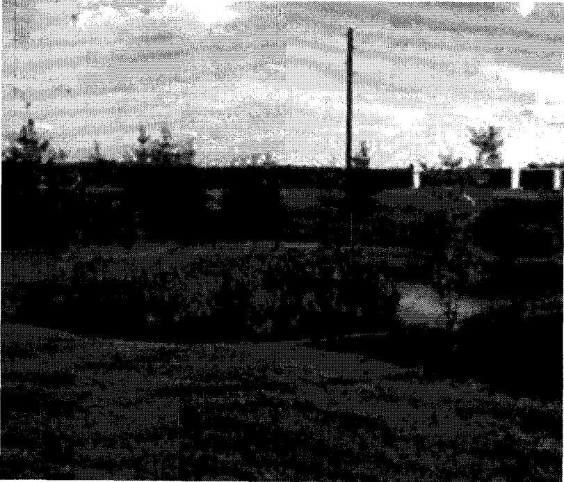
KUVA 7. Maatalouslinjan 1968 maisemoitu palokaivo Somerolla on näkyvä muisto kansalaiskoulusta.

ei ole pienintä aikomusta pyrkiä lukioon! Hän tarvitsisi sitä opetusta, jota kansalaiskoulu tarjosi.