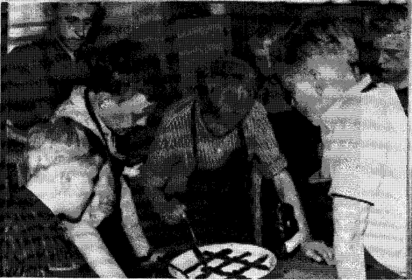
KUVA 3. Kuopiolaispojat koristelevat hillolla maitokiiseliä 1960-luvulla. Valvonta ei petä!.

riittävän laaja yleissivistys, johon kuuluivat tiedot sen yhteiskunnan rakenteista sekä sosiaalista ja taloudellisista oloista, jossa hän tulee toimimaan. Perustan tälle loi kansakoulu, mutta varsinainen yhteiskunnallinen kasvatus kuului nimenomaan kansalaiskoululle. Tähän totuttaisi myös hyvin järjestetty kouluelämä, jossa oppilaille on annettu toimintamahdollisuuksia.