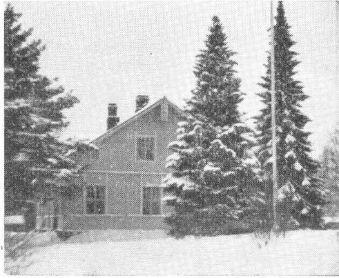
Harvialan kansakoulun vanhan rakennuksen pääty ja talviasuiset kuuset.