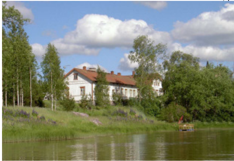
Punkalaitumen Sarkkilan koulu joen takaa nähtynä.