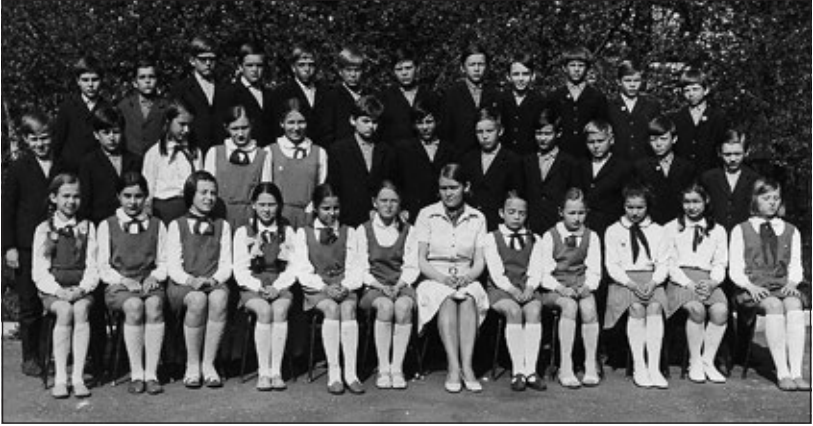
KUVA 7 Tartu X keskkoolin 5. luokan oppilaat, joiden luokanvalvojaksi tulin vuonna 1973.

kan kanssa kevääseen 1979, jolloin luokan oppilaat saivat keskkoolin loppuun ja päättötodistuksensa. Kommunistinuoreksi heistä liittyi vain harva, mutta saattoipa heille korkeakoulussa tulla sitten tilaisuus liittymiseen.