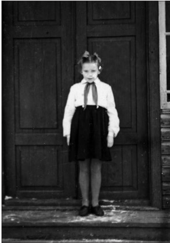
KUVA 6. Alaluokilla ollessani olin oktoobrilaps

Vastaus: Jokaisessa koulussa oli pioneeriosasto (malev), joka koostui salkeista eli koululuokista. Pioneeriosastoon valittiin salkeista 5–10 oppilasta. Oppilaiden lukumäärä vastasi koulun kokoa. Valituista yksi valittiin osaston esimieheksi, eräänlaiseksi puheenjohtajaksi, jonka piti osata selvittää, kuinka kouluelämä ja vapaa-aika sujuivat kommunistisen ideologian mukaan. Hänen tuli osata kaikenlaista hyvin: tanssia, laulaa, ratkoa matematiikan ongelmia, näytellä ja tehdä kädentöitä. Kouluelämä oli aikanamme vastaavanlaista kuin aina muulloinkin,