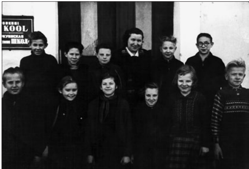
KUVA 2. Yhdysluokkani Assamallaan koulussa

Vastaus: Kouluvuosiinani 1950- ja 1960-luvulla Virossa oli kolmenlaisia kouluja: algkoolit maaseudulla, 7- (myöhemmin 8-) luokkaiset koulut paikkakunnilla, joissa oli 50–150 lasta koulussa ja 1–11 luokkaa käsittävät keskkoolit suuremmissa taajamissa ja kaupungeissa. Koulusta toiseen siirtyminen oli tarvittaessa joustavaa ja mahdollista ilman mitään pääsytkintoja.