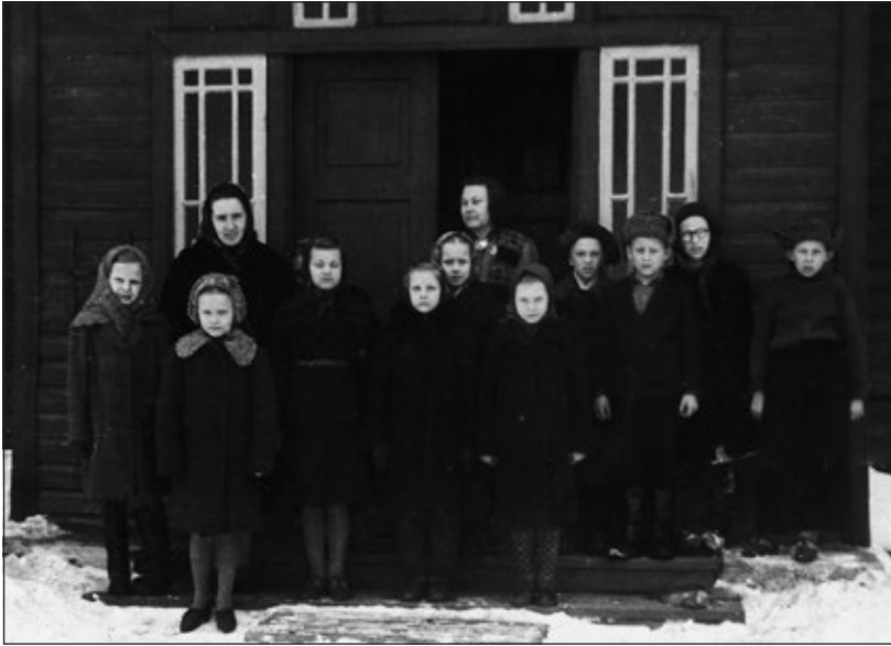
KUVA 5. Porkunin koulussa kävin 5. luokan erillisluokassa.

me mäelle nuotiota tekemään. Lippuja oli vähemmän kuin lapsia. Minä en saanut lippua. Pulpettitoverini vehkeili mäellä ja liehutti lippuaan nenäni edessä: ”Lippu on määrätty minulle!”, hän ilkkui. Saman tien pojat juoksivat saavuttamattomiin, ja niin jäin ilman lippua. Kun naapurini tyttö kotona sitten kertoi ihastellen oman Porkunin koulunsa retkestä, päätin siirtyä Porkuniin.