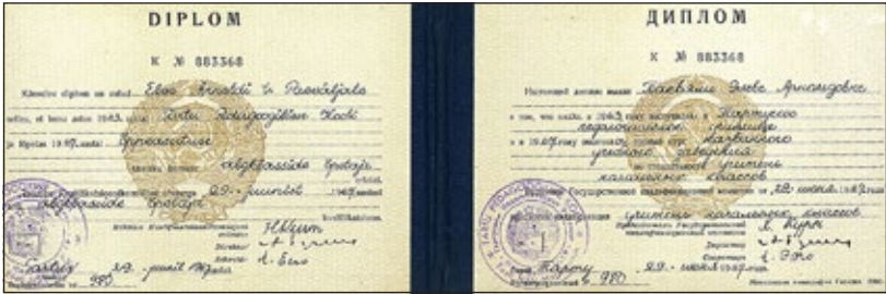
KUVA 4 Opettajadiplomi

mandoliiniorkesteriin ja liikuntaan. Itse kuuluin lisäksi näytelmäpiiriin. Pioneerityötä ei juuri kukaan olisi halunnut valita. Niinpä meille kaikille luennoitiin pioneeriorganisaation perusteista ja toimintamuodoista. Koulun oppilailla oli oma lakki samoin kuin korkeakouluopiskelijoilla. Lakki oli muistona Tartu Õpetajate Instituutista, jossa opiaika keskikoulun käyneille oli kolme vuotta.